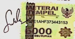
Paulus Miki Sandro