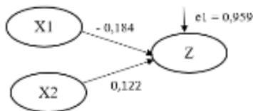
Gambar 4.5.2.3 Diagram Jalur Model II

Berdasarkan analisis diatas yang menghitung koefisien jalur model 1 dan tahap kedua peneliti akan menghitung koefisien jalur model 2. Yakni jika nilai signifikansi lebih kecil dari 0,05 dapat disimpulkan bahwa regresi model 2 ada pengaruh signifikan dari variabel X dan Z terhadap Y. Berdasarkan analisis peneliti