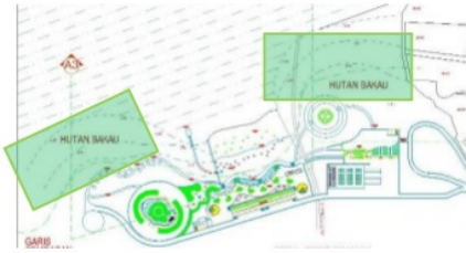
Gambar IV.7 Letak area konservasi hutan bakau

konservasi hutan bakau dapat menjadi zona wisata sekaligus pelindung kawasan wisata agar pengunjung wisata merasa nyaman.