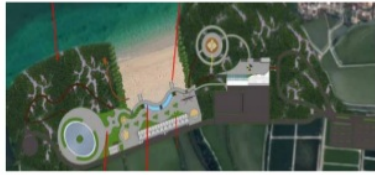
Gambar IV.2 tatanan kawasan wisata.