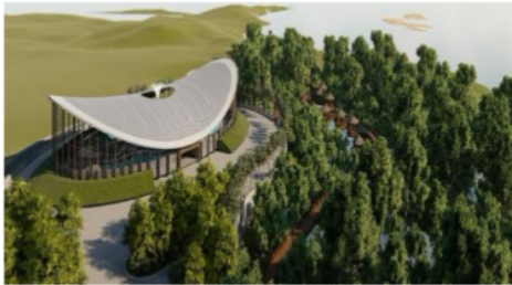
Gambar IV.12 Landmark kawasan wisata yang berfungsi sebagai aquarium biota laut.

Sebuah lambing, atau symbol berupa elemen visual, bentuk yang sangat jelas dan nyata dan memiliki fungsi utama secara visual. Menggunakan konsep arsitektur kerang sebagaimana mencerminkan hal yang identic pada sebuah pesisir pantai yang mengartikan sebuah bangunan yang kokoh dan bisa beradaptasi pada suatu kawasan seperti hidup sebuah kerang. Memiliki unsur pengulangan bentuk dan irama serta menjadi pola bentuk yang uniti pada sebuah kawasan.