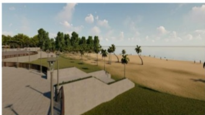
Gambar IV.8 View pantai pada jalur utama

Jalur kawasan terpusat pada area pesisir pantai digunakan untuk keluar masuk pengunjung di dalam kawasan wisata dengan sirkulasi radial ketika pengunjung memasuki kawasan wisata akan mengarahkan pengunjung pada area zona wisata pesisir pantai. Penerapan konsep pada path di jalan menyajikan visualisasi view pantai yang indah, dimana view pantai sangat menarik minat pengunjung wisata dan menambah nilai keindahan dengan pola jalur berkelok-kelok. Penerapan path pada jalur kawasan wisata ini dengan memberikan lebar yang cukup untuk pengunjung keluar masuk, sehingga membuat pandangan pengunjung ke view pantai lebih luas dan indah.