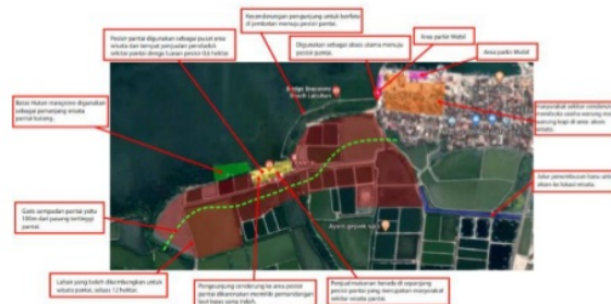
Gambar IV.1 kondisi eksisting kawasan.

Sebuah kawasan wisata pantai pesisir dan area hutan bakau yang menjadi luas pengembangan keseluruhan seluas \pm 14,0 Ha. Kondisi eksisting dan penataan tersajikan dalam gambar berikut :