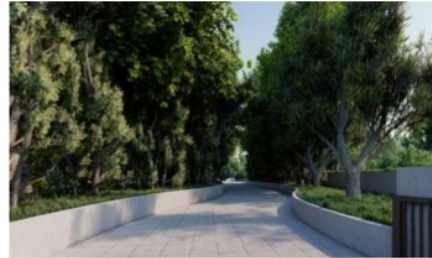
Gambar IV.9 View perbatasan zona wisata pantai dan hutan bakau

memberikan suasana berbeda di antara zona wisata.