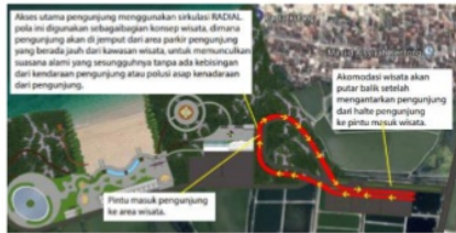
Gambar IV.3 Sirkulasi Pengunjung di luar kawasan

Pada area kawasan wisata maka pola sirkulasi yang digunakan di kawasan ini ialah sirkulasi radial. Dengan pola memusat di zona wisata pesisir pantai. Sehingga pengunjung akan terpusat di pesisir pantai dan menyebar ke seluruh zona wisata sesuai keinginan dan karakteristik pengunjung.