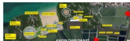
Gambar IV.6 Letak gapura kawasan wisata

Penanda pada kawasan wisata ialah memberikan sebuah gate pintu masuk sebuah kawasan wisata. Dengan bentuk yang menyesuaikan konsep dasar dan bentuk yang mencirikan kawasan wisata pantai, sehingga dapat memberikan informasi yang jelas terhadap suatu kawasan.