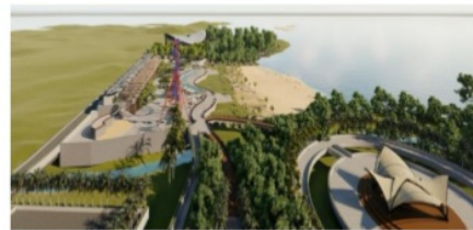
Gambar IV.10 Tepian kawasan wisata pantai kutang.

Tepian dalam kawasan ini merupakan suatu batas site yang menjadi sebuah view visual kawasan yang hanya berfungsi sebagai pembatas dan sebagai pelindung didalam kawasan wisata.