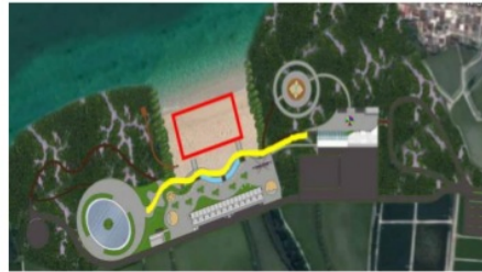
Gambar IV.5 Jalur utama dalam kawasan

Jalur utama wisata diperuntukkan untuk pengunjung yang memasuki kawasan wisata menuju titik pusat di kawasan wisata yaitu pesisir pantai dimana memerlukan jalur yang dapat menampung akses di keseluruhan kawasan wisata.