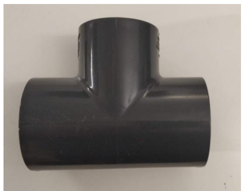
Gambar Shock T