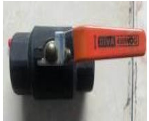
Gambar Body Valve