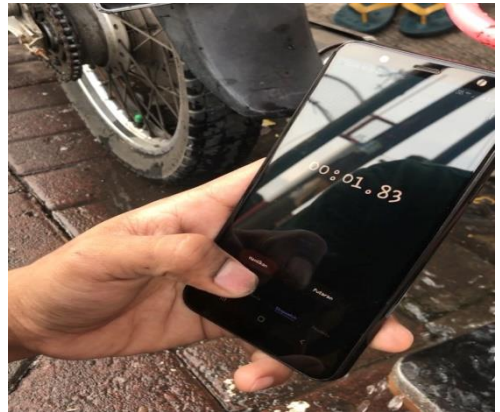
Gambar Stop watch