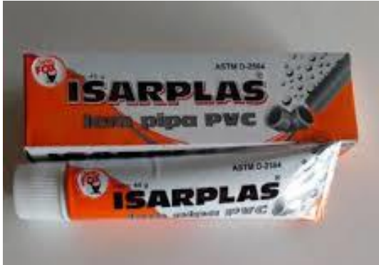
Gambar Lem PVC