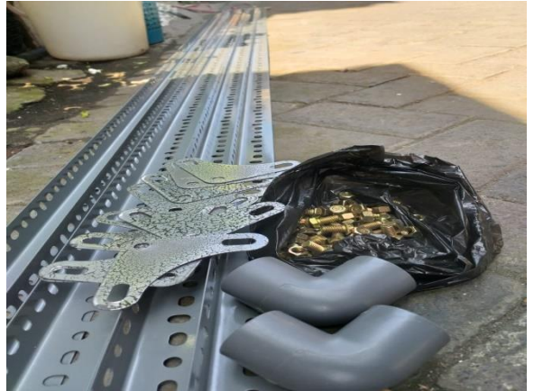
Gambar bahan Penyangga tandon