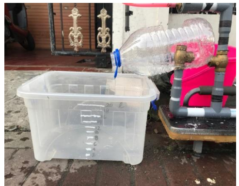
Bak penampungan air