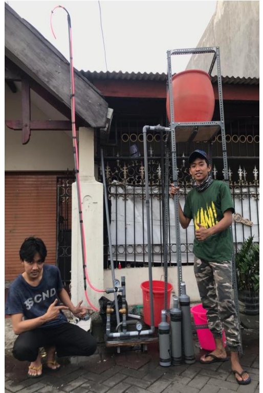
Foto Selesai percobaan