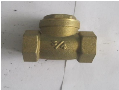
Gambar Klep Buang