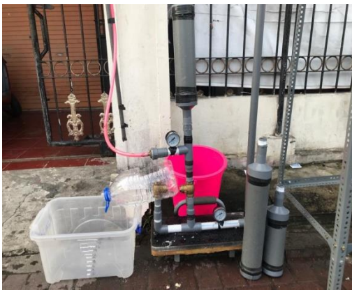
Komponen pompa Hydrum