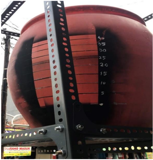
Gambar Tandon Sumber air