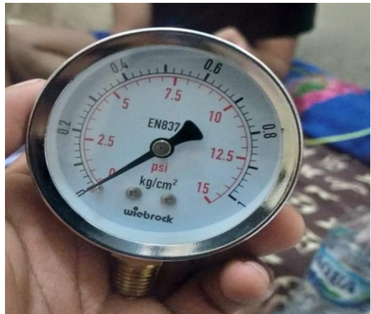
Gambar Pressure Gauge