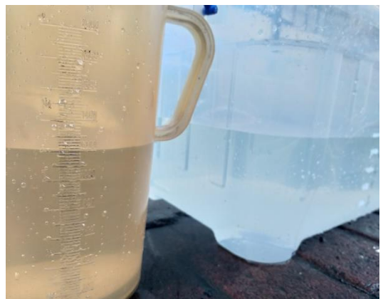
Gambar gelas ukur dengan hasil out dan bak penampung