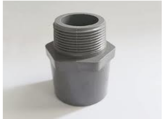
Gambar Shok drat luar