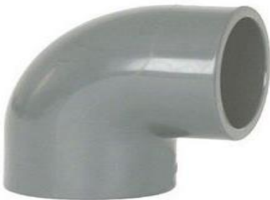
Gambar Knie 90 0