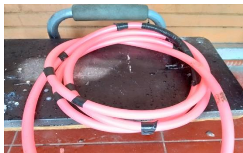
Gambar Selang Output