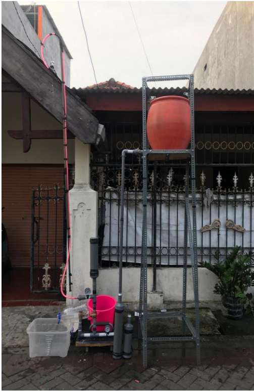
Foto rangkaian pengujian