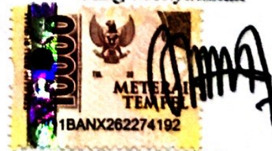
Nabila Fadhia Salama