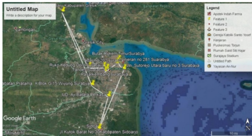
Gambar 1. 3 Rute Usulan

Cluster 2 dengan menggunakan armada W4231NJ