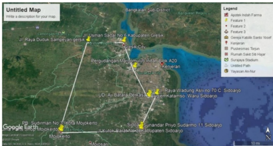
Gambar 1. 5 Rute Usulan