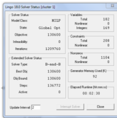
Gambar 1. 2 cluster 1 hasil solution report

Cluster 1 dengan menggunakan armada W8496NJ