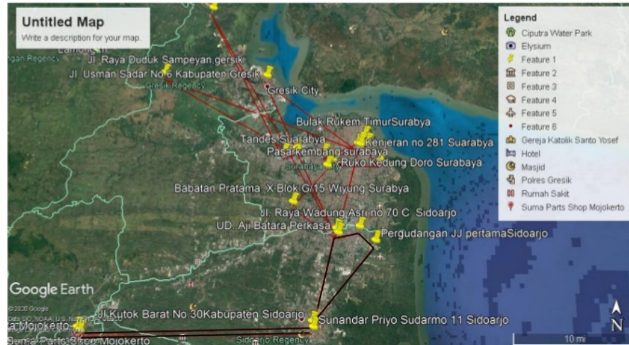
Gambar 1. 1 Rute awal dari perusahaan

Dari gambar 1.1 rute awal tersebut dapat diperoleh total jarak dari tiap kendaraan setiap harinya. Berikut data tabel yang tiap hari digunakan oleh perusahaan: