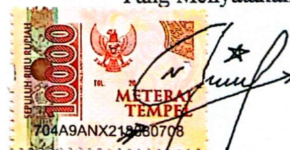
(Nataniel Wellem Tabalena)