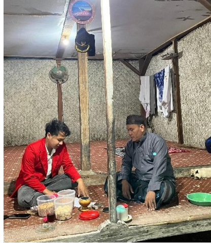
Melakukan Wawancara dengan Pemerintahan Desa Panggung