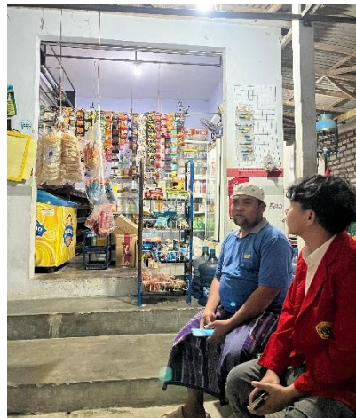
Melakukan Wawancara dengan Pengelola BUMDes