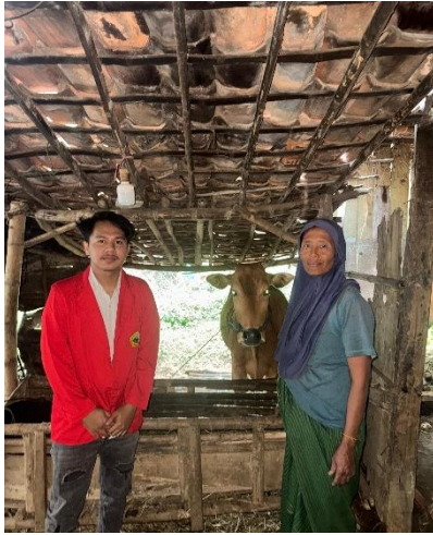
Unit Usaha Peternakan Sapi, Masyarakat Desa Panggung