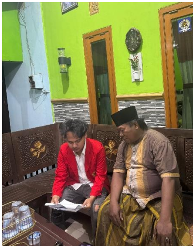
Melakukan Wawancara dengan Masyarakat Desa