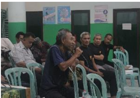
Gambar 1. Musyawarah Desa

Dalam musyawarah yang telah dilaksanakan BUMDes dengan warga telah mengungkapkan bahwa hal ini juga diperkuat oleh masyarakat dalam keterbukaan dalam menegaskan bahwa keterlibatan masyarakat difasilitasi secara terbuka