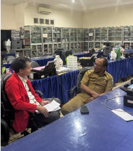
Melakukan Wawancara dengan DPMD