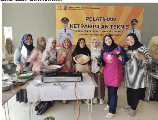
Gambar 4. Jaringan Bisnis Antar Pelaku

Kendala yang disampaikan Ibu Puspita mencerminkan realitas yang dihadapi banyak pelaku usaha mikro, terutama perempuan, yang harus menyeimbangkan antara tanggung jawab usaha dan domestik.