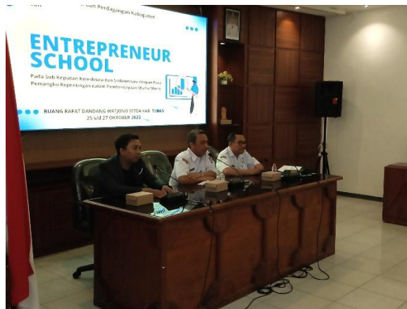
Gambar 2. Program Entrepreneur School

Gambar tersebut menunjukkan suasana kegiatan Entrepreneur School yang diikuti para pelaku UMKM dan PKL. Dalam sesi ini, peserta mendapatkan materi tentang manajemen usaha, pengemasan produk, pemasaran digital, hingga inovasi produk.