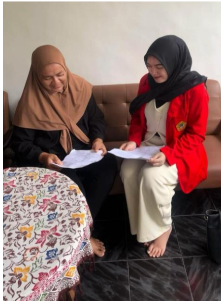
Wawancara Dengan Ibu Puspita Sebagai Pelaku UMKM yang mengikuti pelatihan manjerial