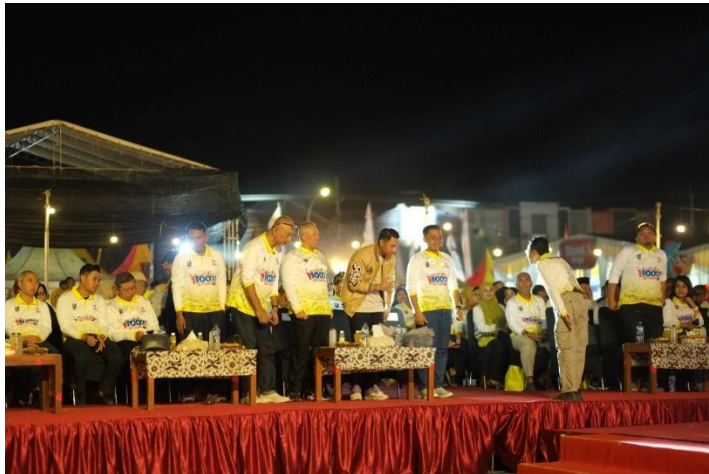
Gambar 1. Festival 100% Tuban

Gambar ini menunjukkan bahwa pemerintah menyediakan ruang bagi UMKM untuk tampil dan mempromosikan produk mereka lewat kegiatan festival seperti ini.