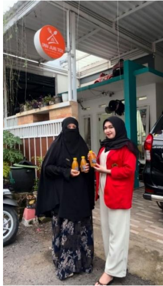
Wawancara Dengan Ibu Raisun sebagai Pelaku UMKM yang mengikuti pelatihan manjerial