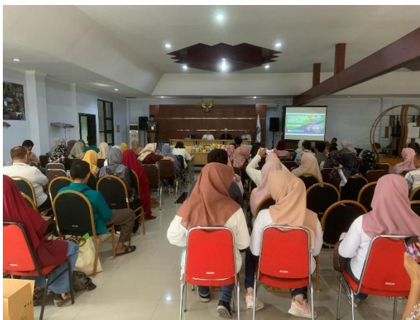
Gambar 3. Pelaku UMKM Mengikuti Program Pelatihan Manajerial

Gambar ini menunjukkan para pelaku UMKM yang sedang ikut pelatihan manajerial. Suasananya cukup ramai, dan para peserta terlihat fokus mengikuti materi yang diberikan. Foto ini menggambarkan bahwa banyak pelaku UMKM yang antusias belajar cara mengelola usaha dengan lebih baik, sesuai dengan penjelasan pada bagian wawancara sebelumnya.