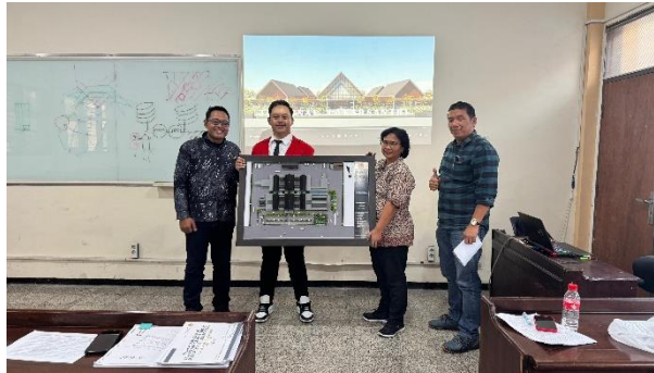
Lampiran 11 Foto Sidang Akhir