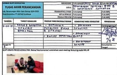
Lampiran 2 Bukti Bimbingan M5