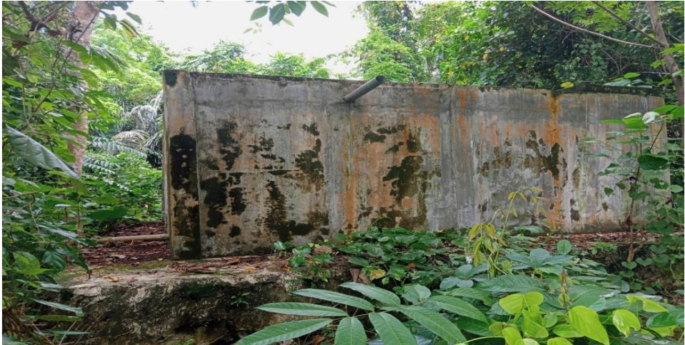
Kegiatan Pembangunan 2016