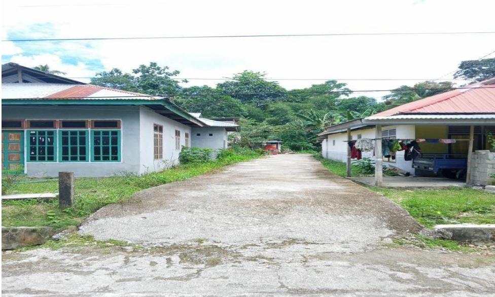
Kegiatan Pembangunan 2017