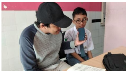
Dokumentasi wawancara bersama para siswa tuna grahita