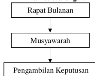
Gambar 1.2 Sistem Pengambilan Keputusan Minimarket Warung L.A

Di atas adalah laporan keuangan Warung LA dari bulan januari sampai desember pada tahun 2019 atau bisa dibilang Laporan Keuangan tahun pertama pada Warung LA Banyubang. Sebagai informasi akuntansi untuk manajemen seharusnya laporan keuangan disesuaikan dengan standar akuntansi yang terdiri dari neraca, laporan laba rugi, laporan perubahan modal, laporan arus kas, dan juga catatan atas laporan keuangan agar mempermudah manajemen untuk menyimpulkan keuangan sebagai dasar pengambilan keputusan jangka pendek maupun jangka panjang. sedangkan dalam pengambilan keputusan manajer minimarket Warung LA menggunakan sistem musyawarah atau kesepakatan bersama yang telah ditetapkan dalam AD/ART perusahaan. Berikut adalah gambaran sistem pengambilan keputusan yang saat ini di terapkan pada minimarket Warung LA Banyubang.