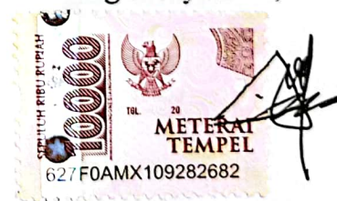
Arel Saputra Setyawan