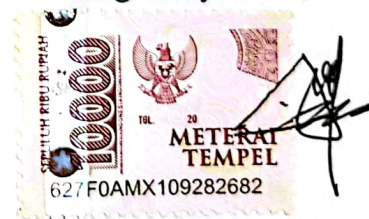
Arel Saputra Setyawan