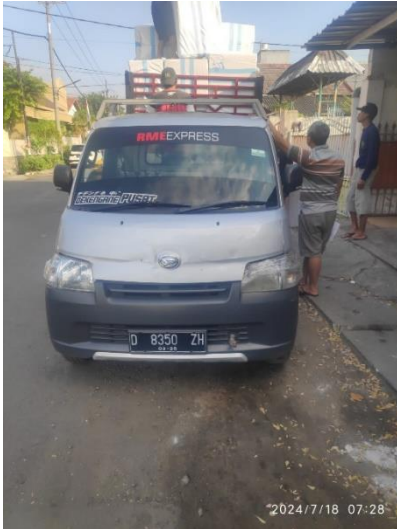
Lampiran 1 Armada dan gudang RME Surabaya