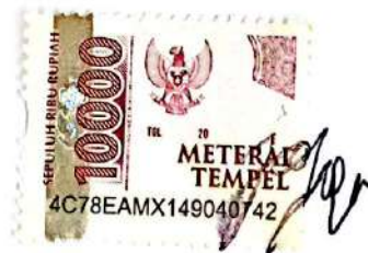
Johanes Alfredo Hutajulu

Surabaya, 13 Desember 2024 Yang membuat pernyataan,