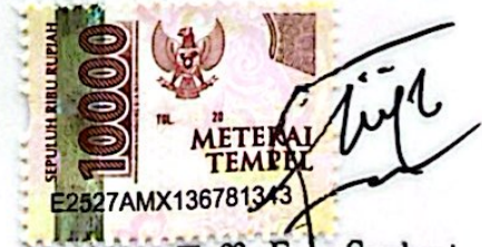
Taffy Farq Syahmi