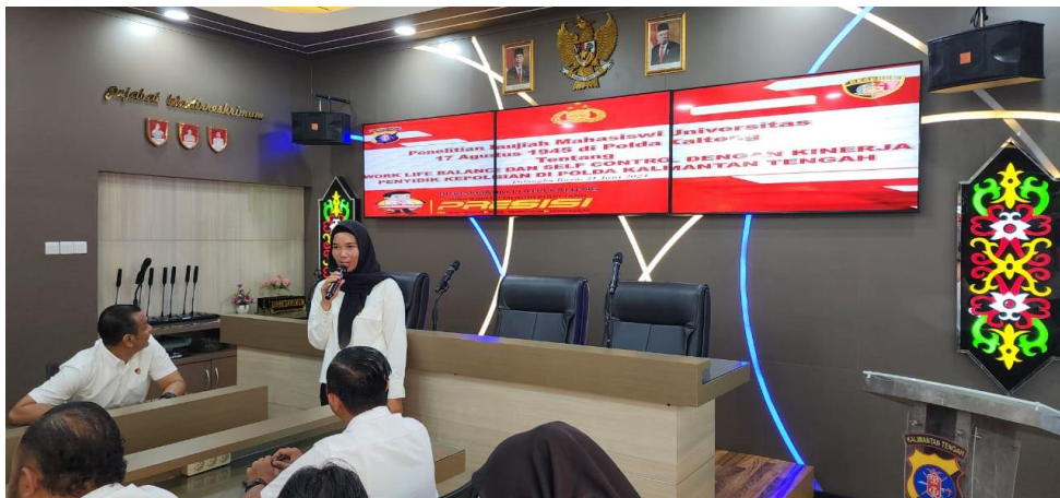
Gambar 2. Dokumentasi 2