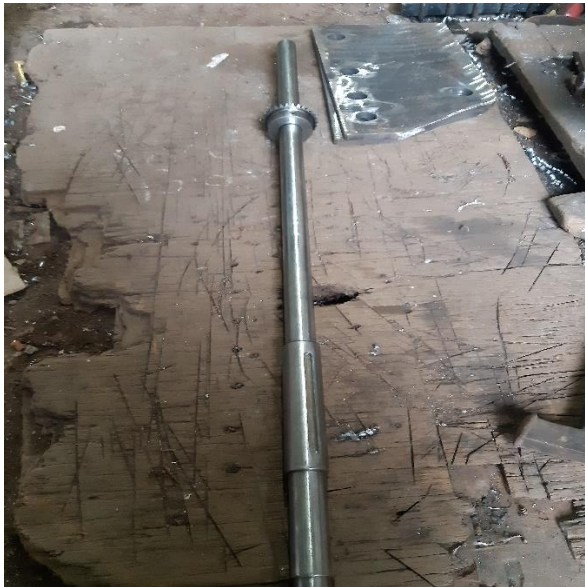
Hasil bubutan poros pengiris