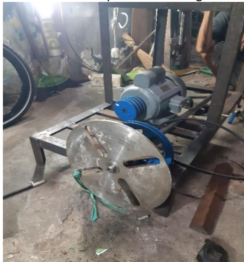
Proses setting penempatan motor, poros, pulley dan piringan