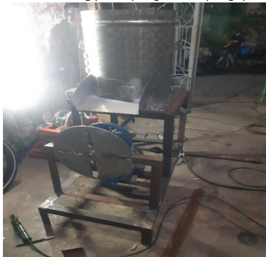
Hasil setelah setting poros dan setting hopper