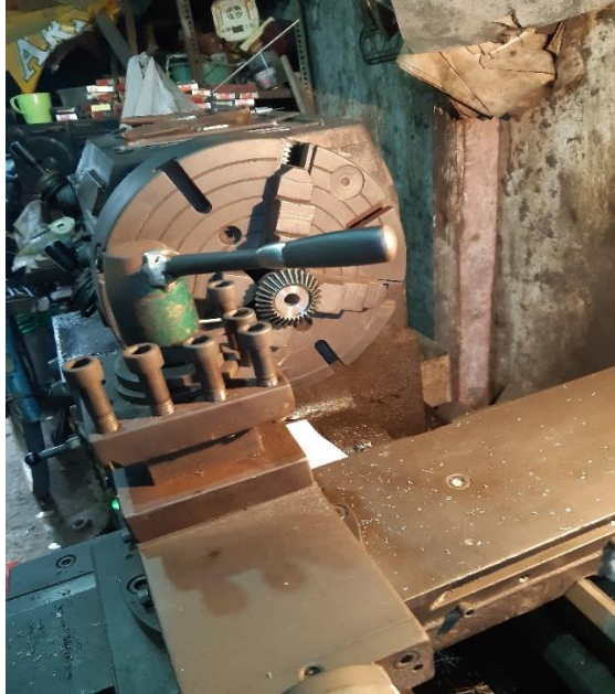
Proses pembubutan pelebaran diameter dalam bevel gear