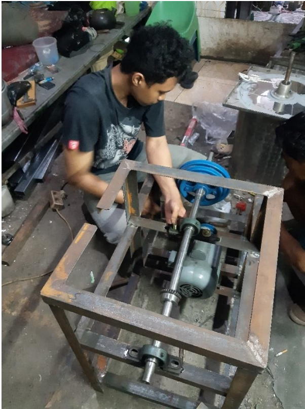
Proses setting poros pengiris dan pengupas