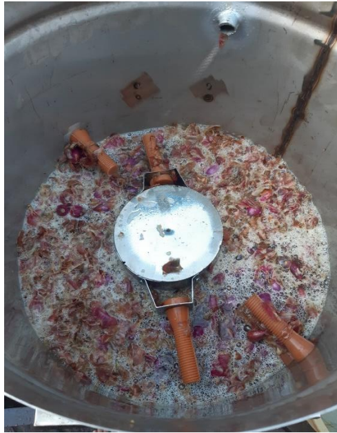
Hasil kupasan bawang