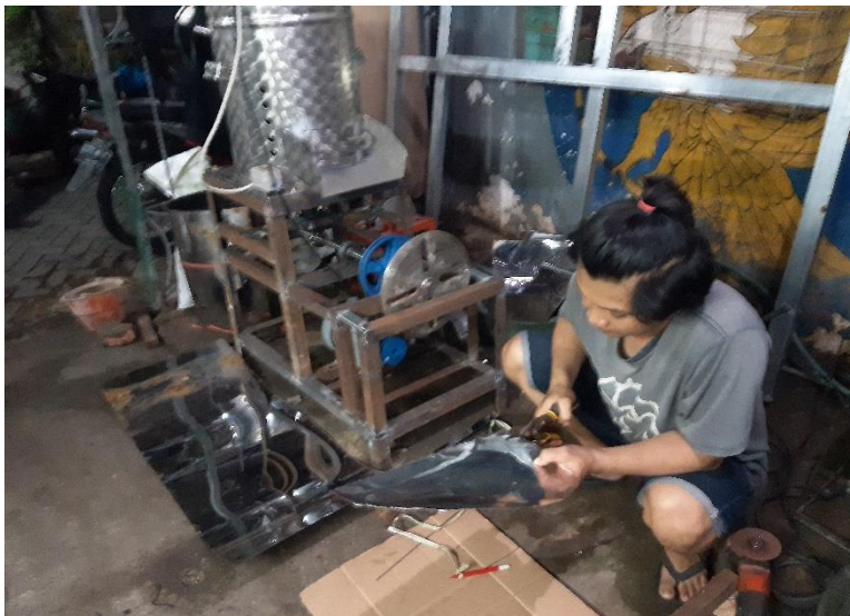
Proses pembuatan cover untuk pengiris