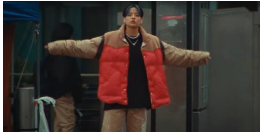
Scene Musik Vidio No More Sad Song

musik vidio tersebut, sehingga menimbulkan kesan dan pemahaman yang lebih dalam mengenai fashion androgini yang diusung oleh Amber Liu.