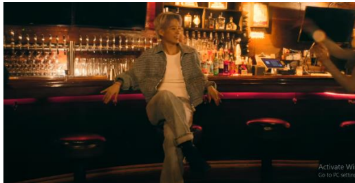
Scene Musik Dusk Till Dawn

Mitos pada scene musik video yang berjudul " Hate My Self " ini, memperlihatkan perempuan yang merasa terkekang akan pemikirannya sendiri dan merasa terkekang dalam bertingkah laku. Musik video ini, memperlihatkan bagaimana ideologi kapitalisme di tunjukan dengan menonjolkan fashion androgini sebagai nilai jual untuk menarik perhatian masyarakat atau penggemar. Yang mana ideologi kapitalisme lebih mementingkan kepentingan diri sendiri ketimbang negara, sehingga memunculkan sikap individualis yang sangat tinggi. Dalam masyarakat perilaku yang menunjukkan kebebasan dalam berpakaian dan bereaksi di luar aturan budaya sosial dianggap tidak sopan. Dengan melalui karya musik ini ia ingin mengekspresikan dirinya agar dapat diterima oleh masyarakat dan para penggemar dengan gestur tubuh yang didukung dengan gaya busana tomboy, unik dan menarik dengan memadukan dua gaya berpakaian perempuan dan laki-laki yang biasa disebut dengan fashion androgini.