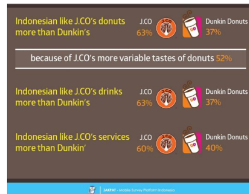
Gambar 1 Penilaian pembeli terhadap J.CO Donuts

Perusahaan J.CO Donuts memiliki banyak pesaing salahsatunya yaitu perusahaan Dunkin' Donuts. Untuk mempertahankan usaha bisnis yang dimiliki J.CO Donut memiliki strategi alternatif seperti memiliki brand image , memperhatikan cita rasa, dan diskon sehingga berpengaruh besar terhadap Keputusan pembelian.