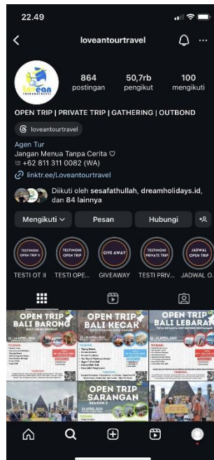
Gambar 4. 8 Halaman Instagram @loveantourtravel