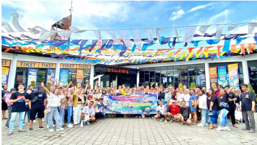
Gambar 4. 10 Produk Lovean Tour and Travel