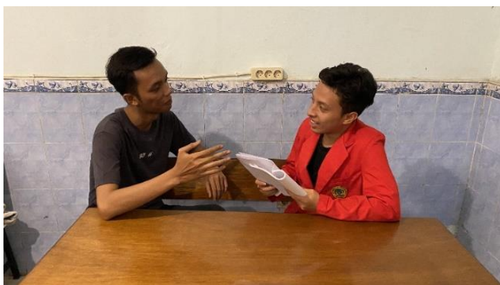
Gambar 4. 12 Wawancara dengan konten kreator @loveantourtravel