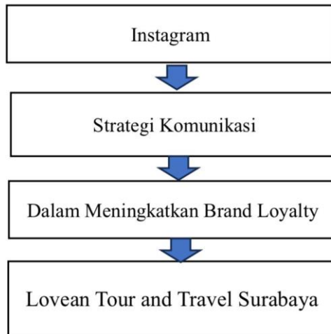
Gambar 2. 2 Kerangka Pemikiran