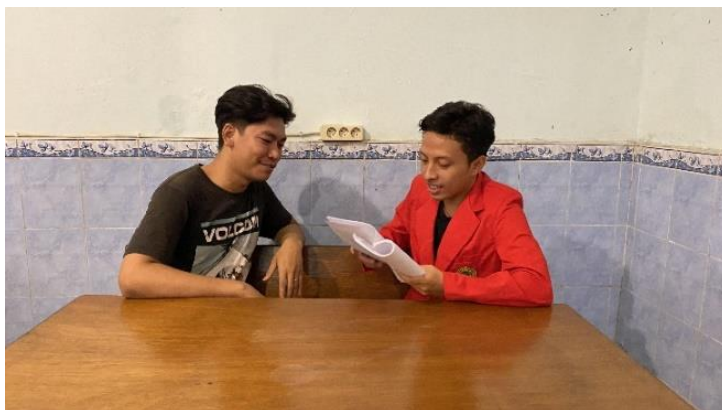
Gambar 4. 11 Wawancara dengan admin Instagram @loveantourtravel