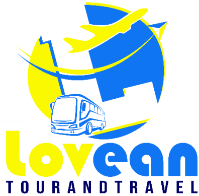
Gambar 4. 7 Logo Lovean Tour and Travel