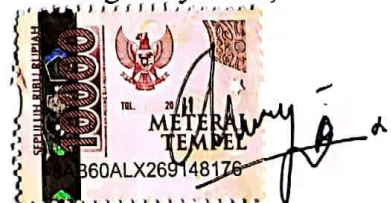
Naafi Nurasni Putri