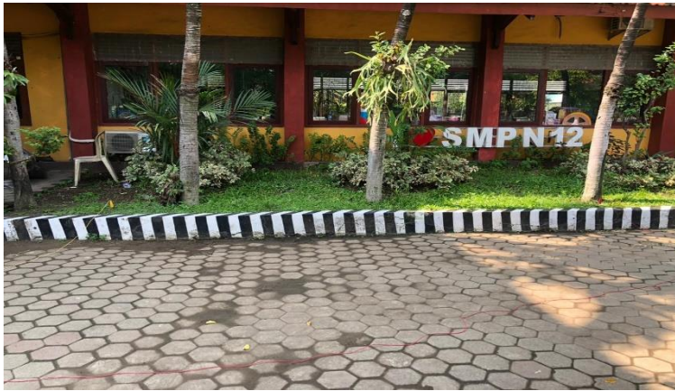
Gambar pengukuran nilai resistansi tanah pada SMP negeri 12 Wringinaom Gresik