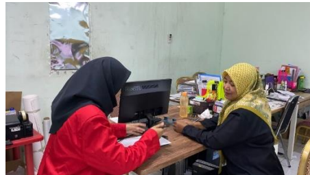
Wawancara dengan Karyawan Tanggal 4 Juni 2024 di Kantor