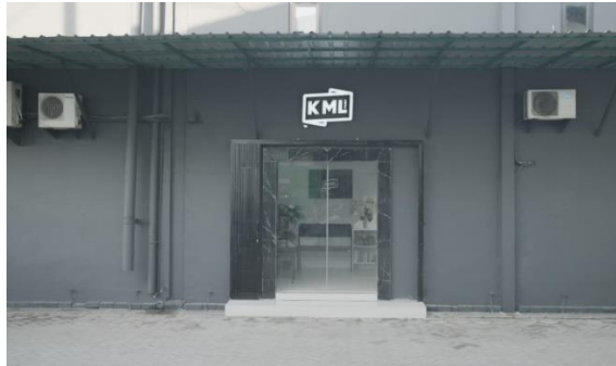
Halaman Depan PT. Karya Mulia Lentera Persada