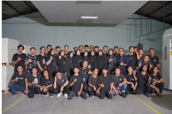
Seluruh karyawan PT. Karya Mulia Lentera Persada