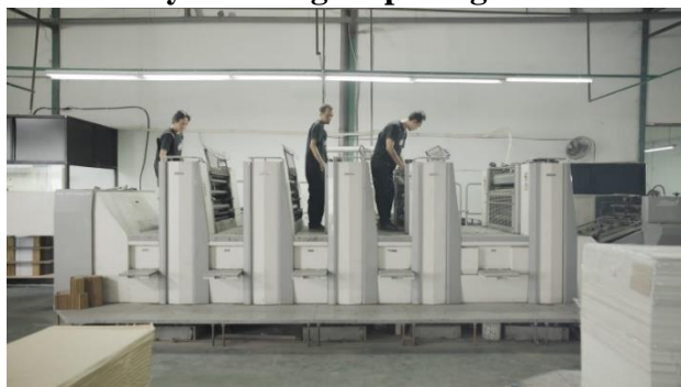
Karyawan bagian cetak mesin Oliver 575