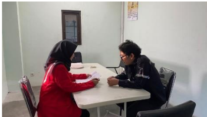
Wawancara dengan Kepala PrePress Tanggal 5 Juni 2024 di Ruang Meeting 2