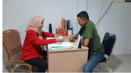
Wawancara dengan Karyawan Cetak Tanggal 4 Juni 2024 di Gudang Tinta