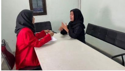
Wawancara dengan staf PPIC Tanggal 31 Mei 2024 di ruang Meeting 2