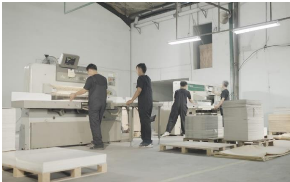
Karyawan bagian potong kertas