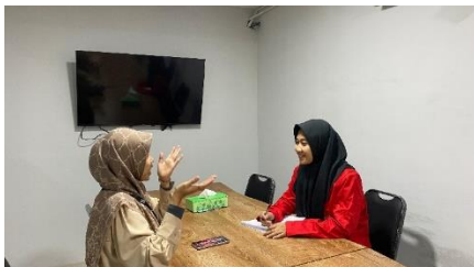
Wawancara dengan HRD Tanggal 7 Juni 2024 di Ruang Meeting 1