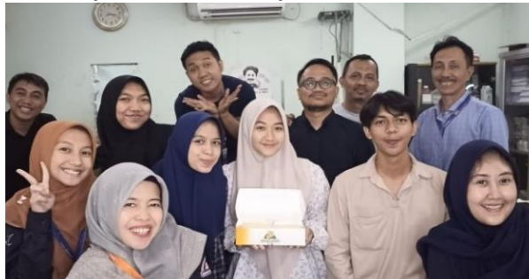
Penulis dengan para staf kantor