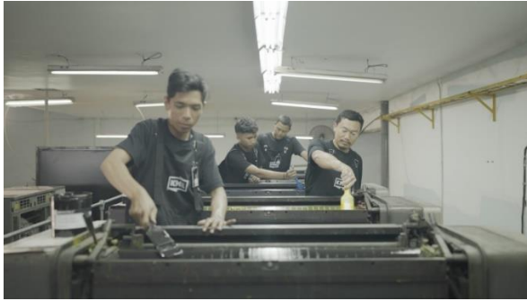
Karyawan bagian cetak mesin CD 6 Warna