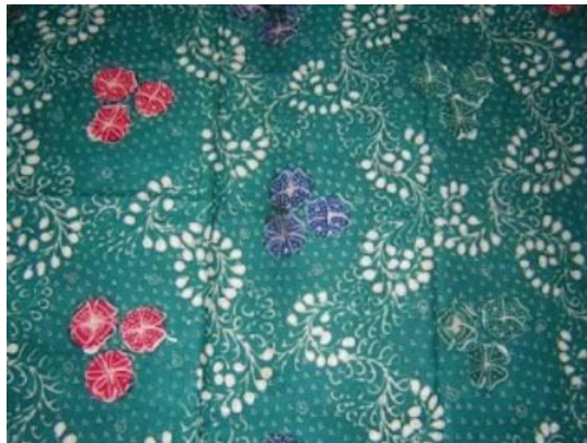
Lampiran 1. 5 Motif Batik Jetis Beras Wutah