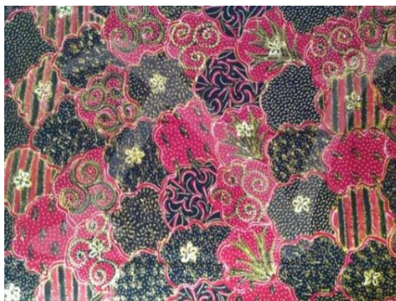
Lampiran 1. 6 Motif Batik Jetis Kembang Bayam