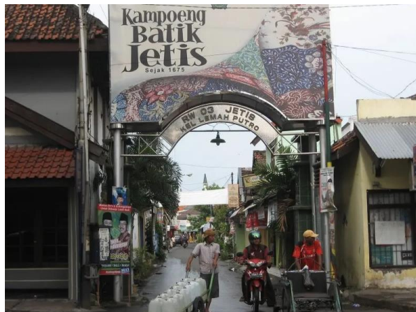
Lampiran 1. 9 Kampoeng Batik Jetis