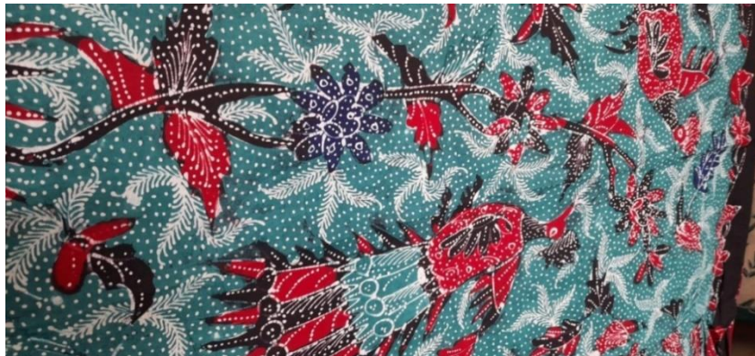
Lampiran 1. 2 Motif Batik Jetis Kembang Bayam