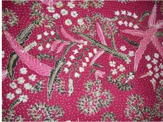
Lampiran 1. 7 Motif Batik Jetis Kembang Tebu