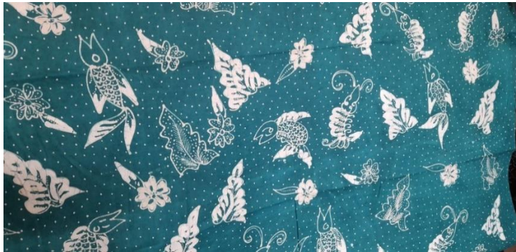
Lampiran 1. 4 Motif Batik Jetis Udang Bandeng