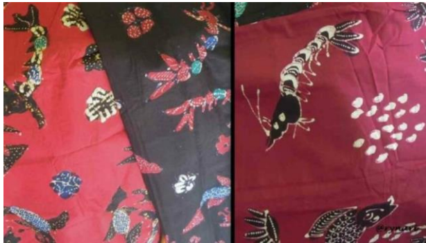
Lampiran 1. 8 Motif Batik Jetis Udang Bandeng