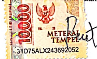
Bartholomews Kislew Subroto