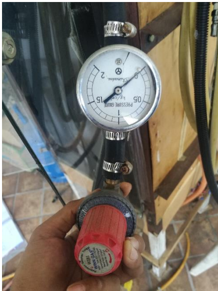
Regulator dan Pressure gauge