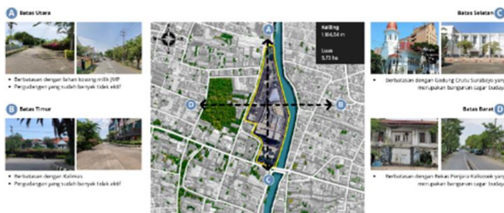
Gambar 4. Batas-batas JMP