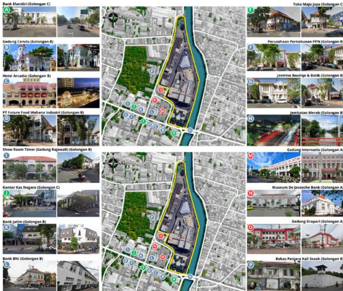
Gambar 8. Klasifikasi bangunan cagar budaya sekitar