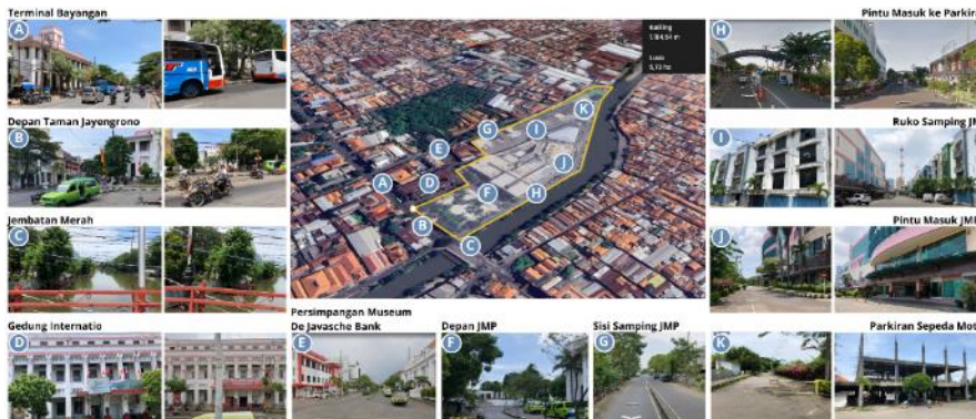
Gambar 6. Kondisi sekitar JMP

Menurut [6] tentang Rencana Detail Tata Ruang Dan Peraturan Zonasi (RDTR) Kota Surabaya Tahun 2018-2038, JMP merupakan zona perdagangan dan jasa dengan skala internasional atau nasional dan JMP termasuk ke dalam kawasan wisata kota lama Surabaya yang akan dikembangkan menjadi wisata budaya berskala nasional maupun internasional.