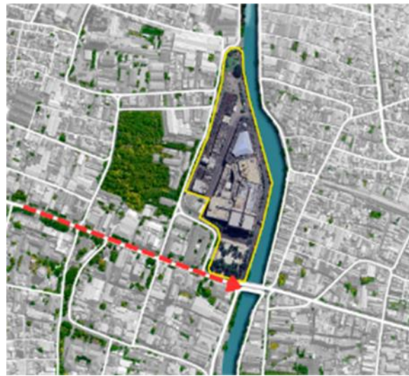
Gambar 1. Akses Jalan Utama JMP

Akses path atau jalan utama pada JMP dapat di akses dari Jalan Rajawali (Gambar 1) yang merupakan jalan arteri sekunder dengan rumija sebesar 20 meter memiliki lajur satu arah terdiri dari 3 sampai 4 lajur dan jalur pedestrian di kedua sisi memiliki lebar sebesar 4 meter dengan tinggi sebesar 55 centimeter. Untuk sirkulasi dalam tapak menggunakan sirkulasi linier antara motor dan mobil.