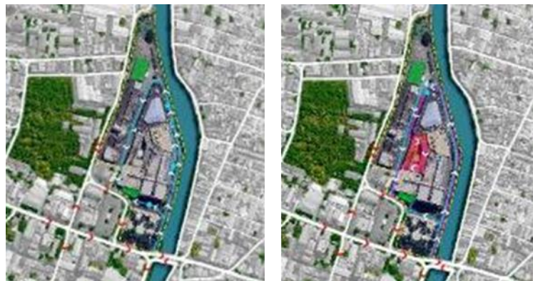
Gambar 2. Sirkulasi pada JMP

Kondisi pedestrian di sekitar JMP sangat baik dan memadai (Gambar 2 dan 3), terdapat pedestrian untuk pejalan kaki berukuran lebar 4 meter di dua sisi dengan ketinggian 55 centimeter. Terintegrasi dengan transportasi umum membuat jalur pedestrian di sekitar tapak sangat bermanfaat dan nyaman untuk pejalan kaki. Namun sebagian besar kondisi pedestrian tersebut di manfaatkan sebagai tempat pangkalan ojek berupa becak motor oleh masyarakat sekitar karena latar belakang JMP yang sebelumnya merupakan bekas terminal penumpang yaitu terminal Jayengrono dan telah menjadi kebiasaan masyarakat sejak dahulu dalam mencari nafkah.