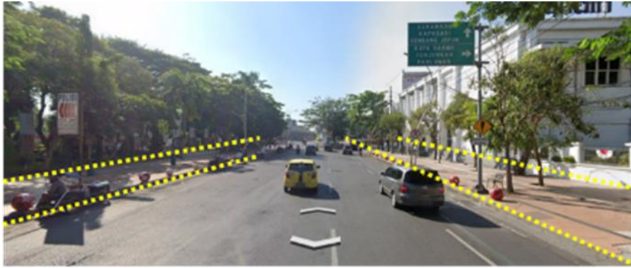
Gambar 3. Jalur pedestrian