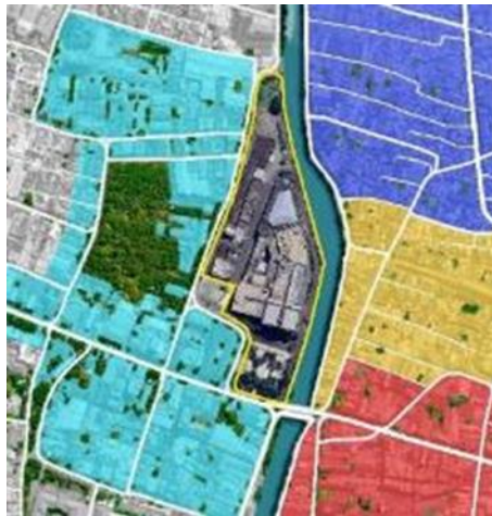
Gambar 5. Zoning kawasan sekitar JMP

JMP berada di kawasan dengan berbagai langgam arsitektur. Warna biru menunjukkan kawasan bangunan dengan gaya atau langgan arsitektur Eropa atau Belanda, warna merah menunjukkan kawasan bangunan dengan gaya atau langgan arsitektur Pecinan, warna kuning menunjukkan kawasan bangunan dengan gaya atau langgan arsitektur Jawa-Melayu, dan warna ungu menunjukkan kawasan bangunan dengan gaya atau langgan arsitektur Arab. Ketika memasuki Jalan Rajawali, pengamat akan merasa “masuk” kedalam zona kawasan cagar budaya dengan langgam arsitektur Eropa atau Belanda. Kemudian melewati JMP, sehingga pengamat juga merasa keluar dari kawasan Eropa atau Belanda yang kemudian memasuki area Pecinan dengan bangunan yang khas Pecinan (Gambar 5 dan 6).