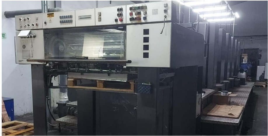
Gambar Lampiran 3 Mesin Printing Lama