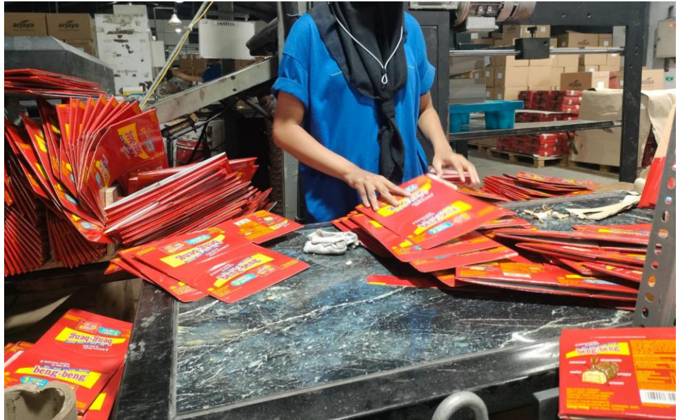
Gambar Lampiran 7 Proses Sortir Barang Reject