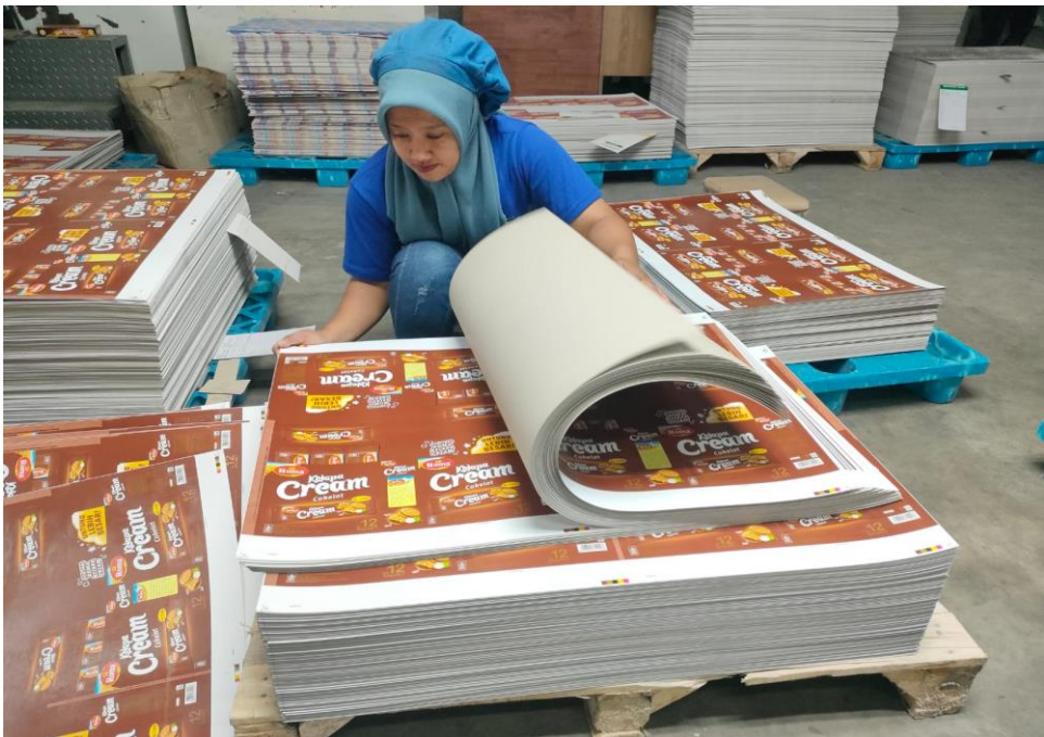
Gambar Lampiran 6 Contoh Hasil Cetak