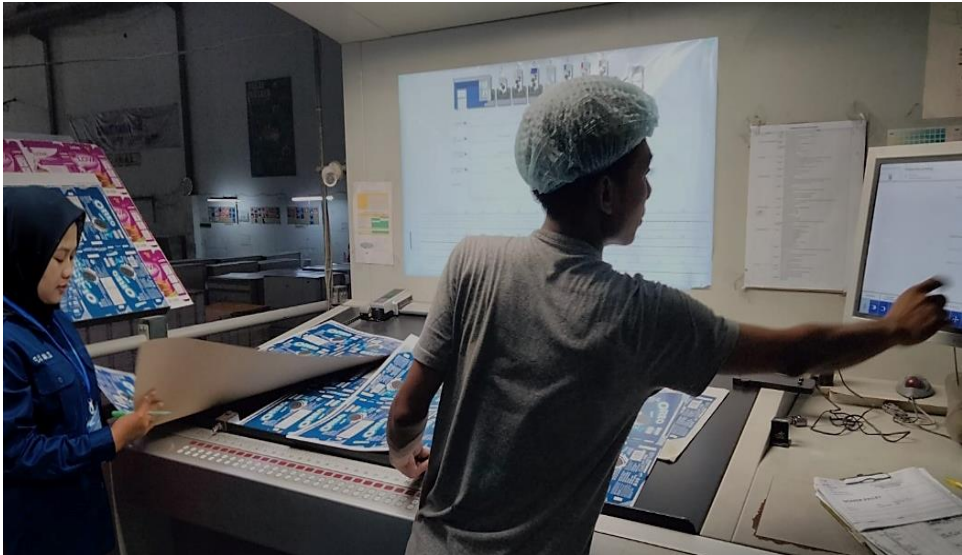
Gambar Lampiran 5 Proses Produksi Cetak