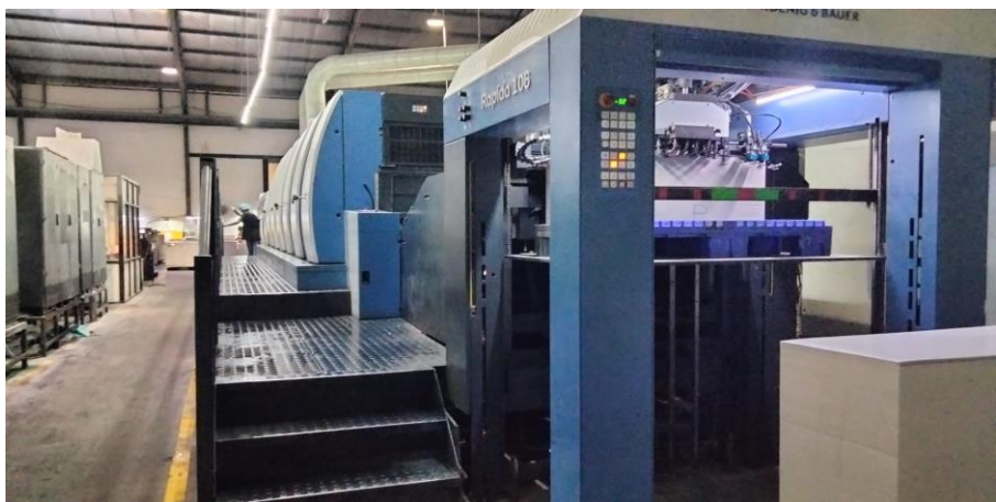
Gambar Lampiran 4 Mesin Printing Baru