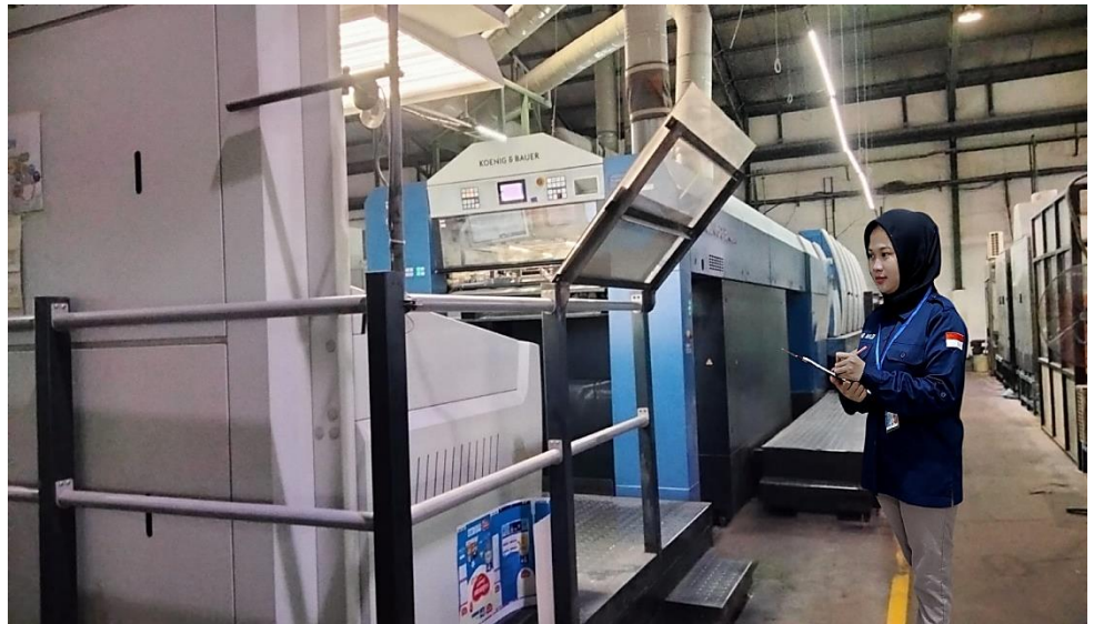
Gambar Lampiran 8 Percobaan Mesin Baru