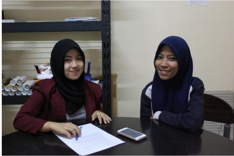
Gambar 5: Kegiatan wawancara dengan Administrasi Gudang CV. Mitra Abadi Surabaya