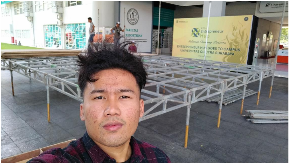
Lampiran 13 Proses Loading Dock