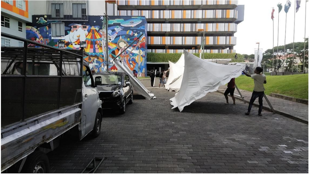
Lampiran 11 Proses Loading Dock