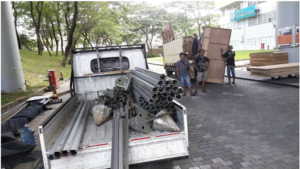
Lampiran 12 Proses Loading Dock