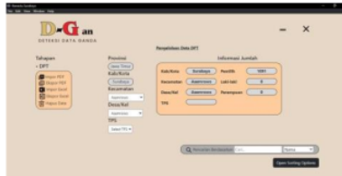
Gambar 8: Tampilan Hasil Halaman Pengelolaan Data

Pada gambar 8 merupakan halaman pengelolaan data dirancang untuk impor dan ekspor data melalui Excel dan PDF. Admin dan super-admin dapat memilih kecamatan dan kelurahan tertentu, mencari data berdasarkan kategori tertentu, dan menampilkan data yang telah diimpor sebelumnya. Admin dan super-admin dapat memilih kecamatan, kelurahan, dan TPS untuk mendeteksi dan menampilkan data sesuai dengan kriteria yang dipilih.