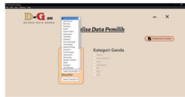
Gambar 10: Tampilan Hasil Halaman Dropdown Kecamatan dan Kelurahan Analisis Data

Pada gambar 10 merupakan halaman analisis data memungkinkan untuk menganalisis data ganda berdasarkan kategori tertentu. Admin dan super-admin dapat memilih kategori dengan menggunakan checkbox dan mendapatkan rekapitulasi hasil analisis. Admin dan super-admin dapat memilih kecamatan dan kelurahan tertentu untuk menampilkan data yang ingin dianalisis.