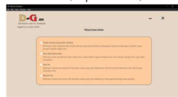
Gambar 18: Tampilan Hasil Super-Admin Halaman Utilitas