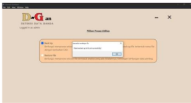
Gambar 15: Tampilan Hasil Admin Halaman Backup Utilitas

Pada gambar 14 merupakan halaman utilitas digunakan untuk backup data, menciptakan salinan sebagai tindakan pencegahan terhadap kehilangan data permanen.