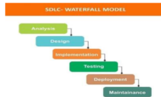
Gambar 21: Tahap Model Waterfall

Pada gambar 1 menjelaskan tentang deskripsi dari metode SDLC, alur awal hingga akhir, sebagai berikut: