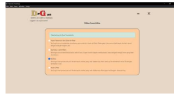
Gambar 21: Tampilan Hasil Super-Admin Halaman Backup Utilitas

Pada gambar 20 dapat berfungsi mendaftarkan user dengan input username, password baru, ketik ulang password, dan juga bisa memilih role user tersebut menjadi admin atau super-admin.