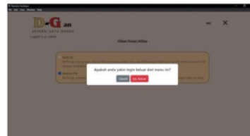
Gambar 17: Tampilan Hasil Admin Halaman Alert Utilitas

Pada gambar 16 merupakan halaman utilitas juga menyediakan opsi untuk merestore file, membantu dalam pengembalian data dari salinan cadangan.