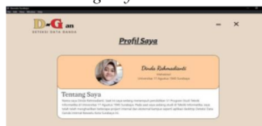
Gambar 23: Tampilan Hasil Halaman Tentang Saya

Pada gambar 23 merupakan halaman yang berfungsi untuk memperkenalkan diri pengembang sebagai pembuat aplikasi deteksi potensi data ganda.