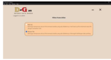
Gambar 16: Tampilan Hasil Admin Halaman Restore File Utilitas

Pada gambar 15 merupakan tampilan admin dapat membuat salinan data dengan memilih opsi backup. Setelah berhasil, admin diberikan pemberitahuan bahwa data telah berhasil dibackup.