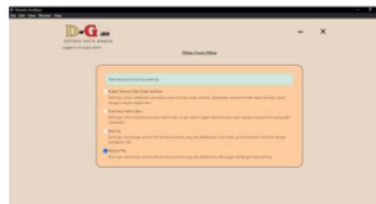
Gambar 22: Tampilan Hasil Super-Admin Halaman Restore File Utilitas

Pada gambar 21 halaman backup berfungsi untuk meminimalisir terjadinya resiko kehilangan data.