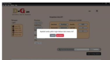
Gambar 9: Tampilan Hasil Halaman Alert Pengelolaan Data

Pada gambar 8 merupakan halaman pengelolaan data dirancang untuk impor dan ekspor data melalui Excel dan PDF. Admin dan super-admin dapat memilih kecamatan dan kelurahan tertentu, mencari data berdasarkan kategori tertentu, dan menampilkan data yang telah diimpor sebelumnya. Admin dan super-admin dapat memilih kecamatan, kelurahan, dan TPS untuk mendeteksi dan menampilkan data sesuai dengan kriteria yang dipilih.