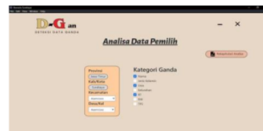
Gambar 11: Tampilan Hasil Halaman

Pada gambar 10 merupakan halaman analisis data memungkinkan untuk menganalisis data ganda berdasarkan kategori tertentu. Admin dan super-admin dapat memilih kategori dengan menggunakan checkbox dan mendapatkan rekapitulasi hasil analisis. Admin dan super-admin dapat memilih kecamatan dan kelurahan tertentu untuk menampilkan data yang ingin dianalisis.