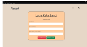
Gambar 5: Tampilan Hasil Halaman Lupa Kata Sandi

sandi, ada opsi untuk membuat kata sandi baru. Setelah perubahan kata sandi, admin diarahkan untuk masuk kembali menggunakan informasi login yang baru.