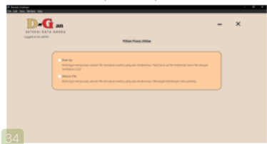
Gambar 14: Tampilan Hasil Admin Halaman Utilitas

Pada gambar 14 merupakan halaman utilitas digunakan untuk backup data, menciptakan salinan sebagai tindakan pencegahan terhadap kehilangan data permanen.