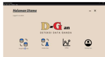
Gambar 6: Tampilan Hasil Halaman Utama

Pada gambar 6 disuguhkan dengan berbagai fitur yang dapat digunakan, seperti pengelolaan data, analisis data, utilitas, dan informasi tentang pengembang aplikasi.