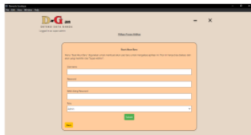
Gambar 20: Tampilan Hasil Super-Admin Halaman Buat Akun Admin Baru

Pada gambar 19 merupakan utilitas yang dapat memilih rubah kata sandi dan kode verifikasi, backup, dan restore file. Super-Admin akan diarahkan untuk masuk ke halaman berikutnya yaitu merubah kata sandi dan kode verifikasi juga memasukkan kata sandi dan kode verifikasi yang lama.