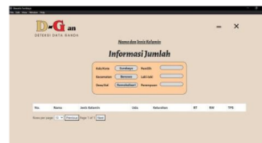
Gambar 12: Tampilan Hasil Halaman Rekapitulasi Data

Pada gambar 11 merupakan checkbox kategori ganda analisis data admin dan super-admin dapat memilih beberapa kategori ganda seperti nama, jenis kelamin, usia, dll., untuk melakukan analisis data.