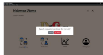
Gambar 7: Tampilan Hasil Alert Halaman Utama

Pada gambar 6 disuguhkan dengan berbagai fitur yang dapat digunakan, seperti pengelolaan data, analisis data, utilitas, dan informasi tentang pengembang aplikasi.