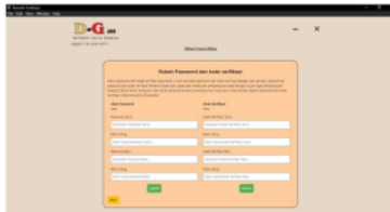
Gambar 19: Tampilan Hasil Super-Admin Halaman Rubah Kata Sandi dan Kode Verifikasi Utilitas

Pada gambar 18 merupakan halaman utilitas yang dapat memilih rubah password dan kode verifikasi, buat akun admin baru, backup data, dan juga bisa restore file.