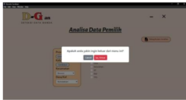
Gambar 13: Tampilan Hasil Halaman Alert Analisis Data

Pada gambar 12 merupakan hasil analisis data ditampilkan dalam bentuk rekapitulasi dengan data yang sesuai dengan kategori ganda yang dipilih. Data ganda ditandai dengan warna khusus.