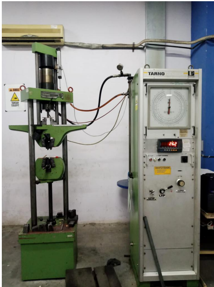
Gambar Lampiran 2 Mesin Uji Tarik