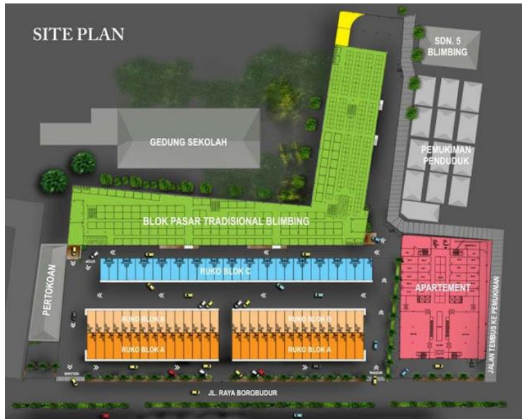
Lampiran 1 Usulan desain siteplan dari pihak PT. KIS tahun 2013 Sumber: (Fauzi, 2014)