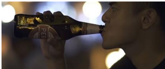
Gambar 2. Scene 2 (Eps 1)

Dari sini terlihat jelas bahwa tanda gaya hidup sehat dalam adegan tersebut mengacu pada kurangnya kesadaran masyarakat saat ini terhadap kesehatan dirinya sendiri dan orang lain pada khususnya. Perubahan dalam hal ini sebaiknya dimulai dari hal-hal sederhana yang berhubungan dengan kesehatan, seperti memenuhi kebutuhan tubuh akan istirahat dan menjauhi zat-zat tidak sehat seperti rokok.