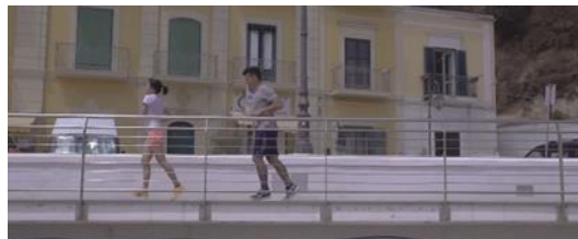
Gambar 4. Scene 5 (Eps 4)

Kontruksi industri akan prinsip dasar hidup sehat adalah Seseorang bekerja pada jam produktivitas pagi dan sore hari guna memenuhi kebutuhan alami tubuhnya akan gerak dan istirahat pada waktu yang tepat. Ia mengilustrasikan salah satu cara menjaga kesehatan dengan cara ini karena tubuh memerlukan istirahat dan aktivitas pada waktu yang berbeda-beda.