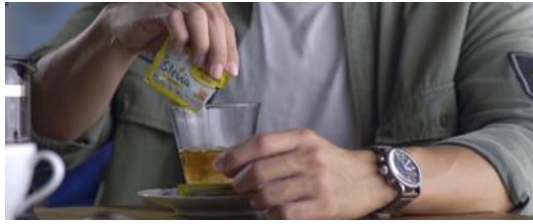
Gambar 5. Scene 8 (Eps 9)

Kontruksi akan pesan hidup sehat yang disampaikan oleh Tropicana Slim pada scene ini dengan mengonsumsi gula buatan rendah kalori yaitu Tropicana Slim Stevia dimana didalam iklan produk stevia diperkirakan meningkatkan pelepasan insulin dan mencegah penyerapan glukosa di usus. Dalam hal ini, pemanis ini dapat membantu menurunkan berat badan, menjaga berat badan ideal, dan mengatur kadar gula darah pada penderita diabetes.