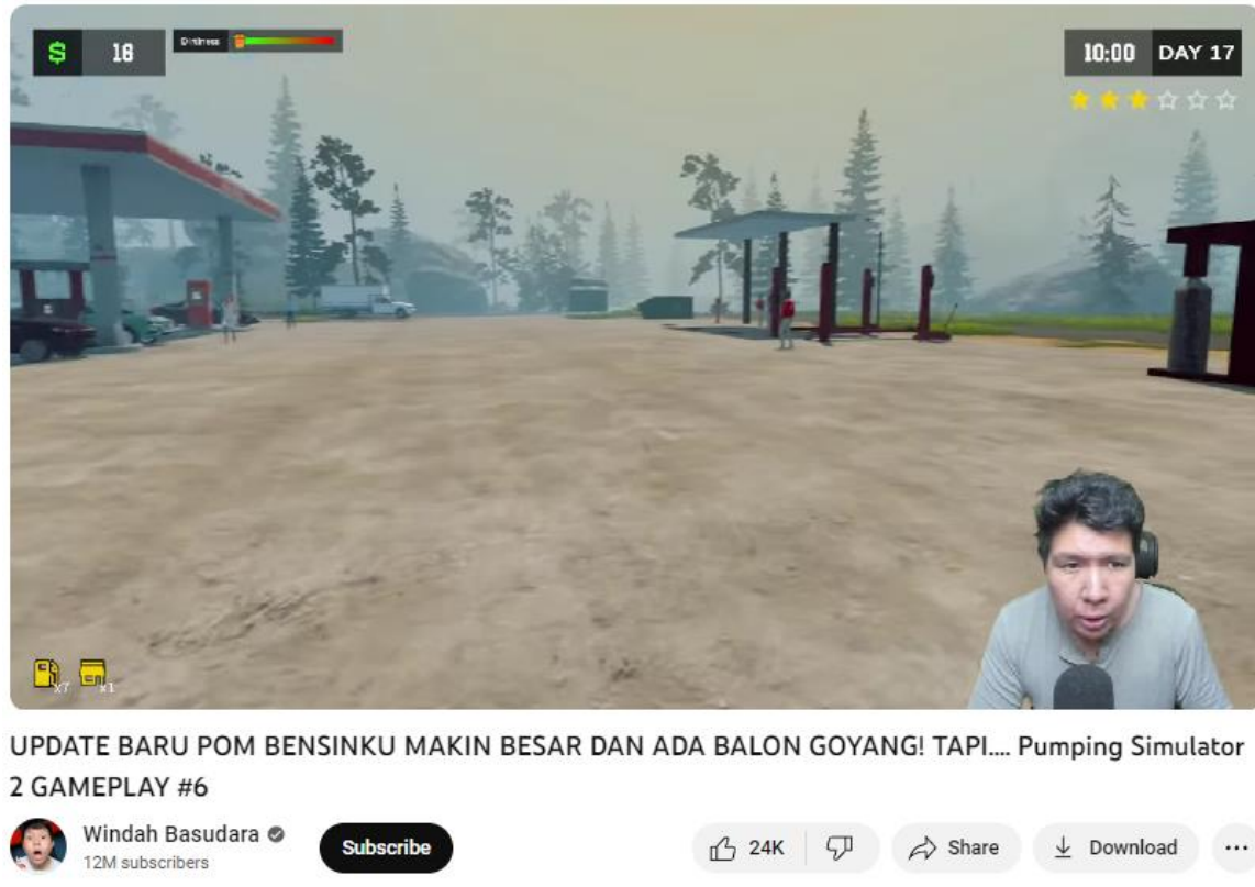
Gambar Scene Youtube Windah Basudara

Pada scene tersebut Windah bermain selama kurang lebih hampir 2 jam. Selama hampir 2 jam tersebut Windah bermain dengan berinteraksi kepada para penonton yang menonton siaran langsung pada kanal youtube miliknya. Tidak hanya berinteraksi secara langsung melalui live chat, windah juga menyapa penonton nya yang menonton replay siaran langsung nya pada pembukaan dia memulai gamenya.