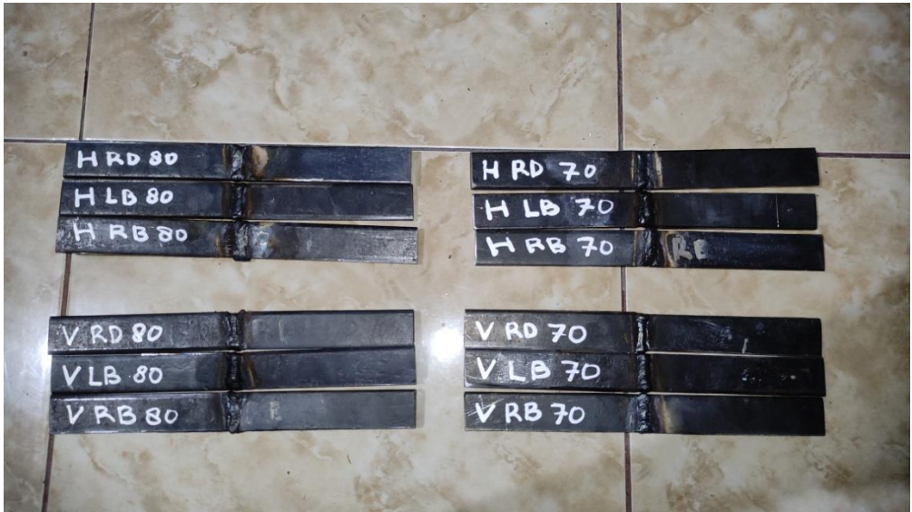
Lampiran 6 Proses pengefraisan spesimen