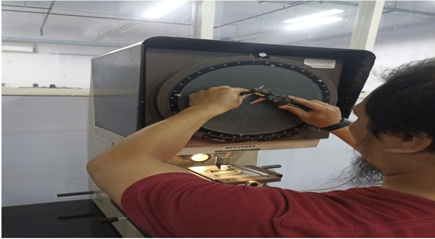
Lampiran 9 hasil setelah pengujian tarik