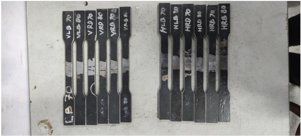
Lampiran 8 Proses pengujian tarik