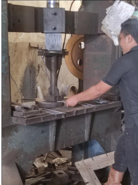
Lampiran 2 proses pemotongan spesimen sebelum di las