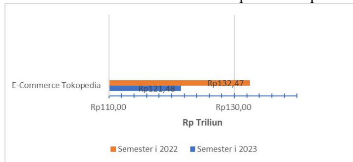
Gambar 2 Nilai Transaksi Marketplace Tokopedia

Dalam tabel yang disajikan, Tokopedia tampak menjadi salah satu marketplace favorit di kalangan masyarakat, menduduki posisi kedua dengan jumlah pengunjung terbanyak. Namun, terdapat tren penurunan pengunjung pada Tokopedia, yang dapat diamati dari data pada kuartal I Mei 2023 yang mencatat 117 juta pengunjung, mengalami penurunan menjadi 107,2 juta pengunjung pada kuartal II Juli 2023.