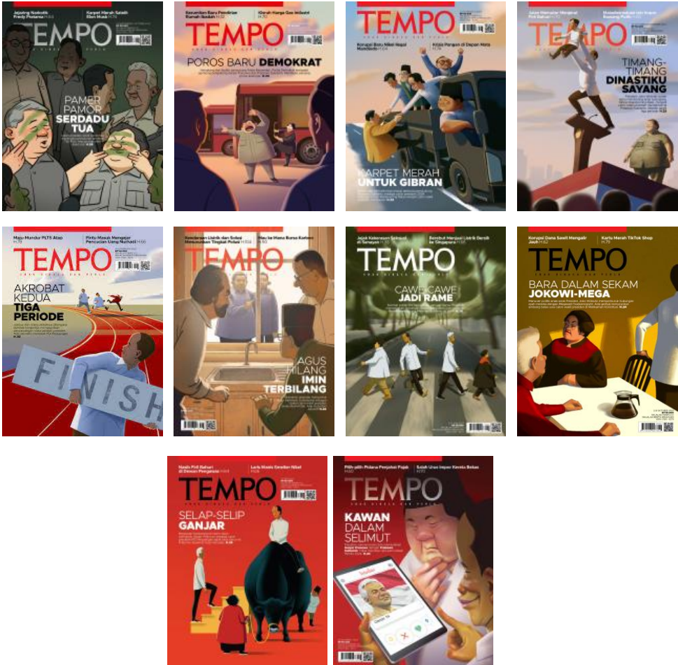
Lampiran 1 Objek Sampul Majalah Tempo Februari-Oktobre 2023