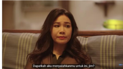
Gambar 10. Potongan Adegan Episode 7 (2/4) Menit 0:28

Fase ini merupakan fase di mana individu merasa khawatir dan beranggapan bahwa ia telah mengecewakan keluarga atau orang terdekat lainnya karena tidak dapat memenuhi ekspektasi yang diinginkan. Fase ini direpresentasikan melalui scene 6 di mana Jim dan sang kakak mengetahui bahwa Li-Ming merupakan seorang gay.