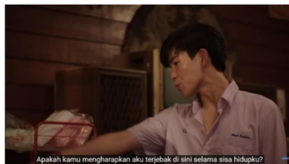
Gambar 9. Potongan Adegan Episode 3 (3/4) Menit 7:12

Hal tersebut digambarkan melalui kode dialog dalam analisis level representasi. Beberapa dialog yang diucapkan oleh Jim yaitu “Kamu? Pergi ke Amerika? Untuk apa kamu pergi kesana dengan nilai yang rendah?”, “Apakah kamu percaya kamu bisa mendaratkan kakimu di sana?”, “Apa yang bisa kamu lakukan di sana?”, “Apakah kamu bahkan punya uang untuk membawamu ke sana?”. Mendengar berbagai macam pertanyaan yang diucapkan oleh Jim, Li-Ming semakin merasa tertekan dan kesal karena ia merasa pamannya tidak percaya dengan dirinya sehingga ia mengatakan “Apakah paman mengharapkan aku untuk terjebak di sini selama sisa hidupku?”. Li-Ming merasa ia sudah dewasa dan tidak ingin terus memberikan beban kepada Jim. Ia ingin hidup mandiri di Amerika dengan mencari kerja serta pengalaman di sana.