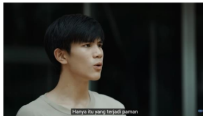
Gambar 5. Potongan Adegan Episode 1 (4/4) Menit 2:23

Pada analisis level realitas melalui kode lingkungan diketahui bahwa Jim dan Li-Ming merupakan keluarga kecil dengan perekonomian yang tidak stabil dan bukan merupakan keluarga terpandang seperti keluarga Heart. Ayah Heart merupakan seorang polisi sehingga ketika Li-Ming dituduh telah memecahkan botol minuman keras milik ayah Heart, Jim dan Li-Ming merasa terjebak dalam situasi yang sulit karena mereka tidak dapat membantah tuduhan tersebut. Meskipun mereka akhirnya mengalah, Li-Ming tetap merasa kesal atas tuduhan tersebut. Li-Ming kesal karena kebenaran yang sesungguhnya adalah Heart memecahkan botol minuman keras milik ayahnya ketika ia terkejut dengan kehadiran Li-Ming. Heart merupakan seorang tuli sehingga ia tidak mendengar ketika Li-Ming datang dan menghampirinya.