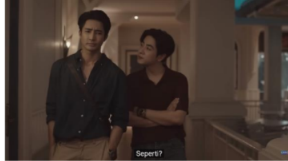
Gambar 2. Potongan Adegan Episode 3 (4/4) Menit 9:20

keponakannya (Li-Ming). Pada scene tersebut Jim bercerita kepada Wen bahwa ia merasa gagal dalam membesarkan Li-Ming karena Li-Ming tidak pernah bercerita mengenai hal apa pun kepada Jim. Jim juga mengatakan bahwa Li-Ming merupakan keponakan yang sangat sulit untuk dihadapi, ia selalu membantah perkataan Jim.