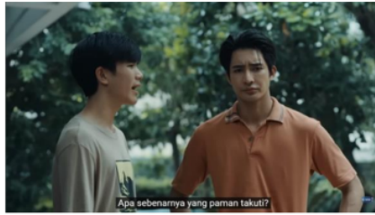
Gambar 6. Potongan Adegan Episode 1 (4/4) Menit 3:45

Rasa kesal Li-Ming digambarkan melalui kode ucapan, kode gerakan dan kode ekspresi pada analisis level realitas. Ketika menceritakan mengenai kejadian sebenarnya kepada Jim, Li-Ming bercerita dengan nada kesal dan tegas serta menunjukkan ekspresi kesal seperti pada gambar 5. Tidak hanya Li-Ming, Jim juga menunjukkan ekspresi kesal dan tegas dengan kedua tangan yang terus ditempatkan di pinggang seperti pada gambar 6. Melalui analisis level representasi dengan kode kamera, gerakan dan ekspresi Li-Ming dan Jim digambarkan dengan baik melalui teknik pengambilan gambar Full Shot, Medium Shot, dan Medium Close Up.