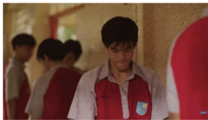
Gambar 7. Potongan Adegan Episode 2 (2/4) Menit 7:16

Fase ini merupakan fase di mana individu merasa cemas atau khawatir akan hal-hal yang belum terjadi. Fase cemas direpresentasikan melalui scene 2 di mana Li-Ming merasa gelisah dan cemas ketika mendengar teman-temannya telah memiliki rencana yang pasti untuk masa depan mereka, sedangkan Li-Ming masih belum mengetahui pasti apa yang ingin ia lakukan. Melalui analisis level realitas dengan kode lingkungan, perasaan cemas yang dialami Li-Ming disebabkan oleh keadaan di mana Li-Ming tumbuh besar di keluarga yang tidak memiliki perekonomian yang stabil, sedangkan teman-teman Li-Ming hidup di keluarga yang sangat berkecukupan. Sehingga Li-Ming tidak memiliki keistimewaan yang dimiliki oleh temannya, seperti memilih untuk masuk ke universitas swasta tanpa perlu mengikuti tes masuk.