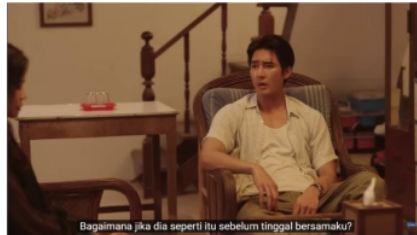
Gambar 11. Potongan Adegan Episode 7 (2/4) Menit 0:40

Pada scene ini Jam, kakak Jim yang juga merupakan Ibu dari Li-Ming merasa bahwa Li-Ming secara tiba-tiba menjadi seorang gay karena terpengaruh oleh kehidupan pamannya yang juga merupakan seorang gay. Hal tersebut digambarkan melalui dialog yang diucapkan oleh Jam pada gambar 10. Jam menyalahkan Jim karena menurutnya selama Li-Ming tinggal bersamanya, ia tidak pernah menunjukkan ketertarikannya kepada laki-laki. Sehingga Jam merasa bahwa Jim memiliki pengaruh yang besar akan perubahan yang dialami oleh Li-Ming.