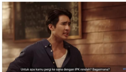
Gambar 8. Potongan Adegan Episode 3 (3/4) Menit 6:52

Pada analisis level realitas dengan kode lingkungan ditemukan bahwa Jim dan Li-Ming merupakan keluarga yang memiliki ketidakstabilan perekonomian. Hal tersebut yang membuat Jim sangat terkejut dengan pilihan Li-Ming untuk pergi ke Amerika. Jim merasa bahwa mereka bukan keluarga yang memiliki kesempatan untuk bepergian ke luar negeri karena di Pattaya saja mereka masih harus berjuang dengan sangat keras untuk memenuhi kebutuhan sehari-hari.