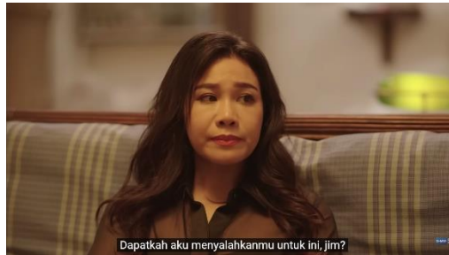
Gambar 10. Potongan Adegan Episode 7 (2/4) Menit 0:28

Fase ini merupakan fase di mana individu merasa khawatir dan beranggapan bahwa ia telah mengecewakan keluarga atau orang terdekat lainnya karena tidak dapat memenuhi ekspektasi yang diinginkan. Fase ini direpresentasikan melalui scene 6 di mana Jim dan sang kakak mengetahui bahwa Li-Ming merupakan seorang gay.