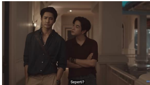
Gambar 2. Potongan Adegan Episode 3 (4/4) Menit 9:20

keponakannya (Li-Ming). Pada scene tersebut Jim bercerita kepada Wen bahwa ia merasa gagal dalam membesarkan Li-Ming karena Li-Ming tidak pernah bercerita mengenai hal apa pun kepada Jim. Jim juga mengatakan bahwa Li-Ming merupakan keponakan yang sangat sulit untuk dihadapi, ia selalu membantah perkataan Jim.