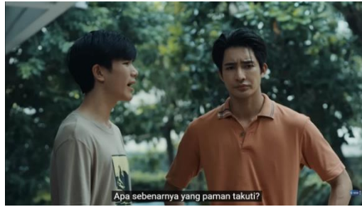
Gambar 6. Potongan Adegan Episode 1 (4/4) Menit 3:45

Rasa kesal Li-Ming digambarkan melalui kode ucapan, kode gerakan dan kode ekspresi pada analisis level realitas. Ketika menceritakan mengenai kejadian sebenarnya kepada Jim, Li-Ming bercerita dengan nada kesal dan tegas serta menunjukkan ekspresi kesal seperti pada gambar 5. Tidak hanya Li-Ming, Jim juga menunjukkan ekspresi kesal dan tegas dengan kedua tangan yang terus ditempatkan di pinggang seperti pada gambar 6. Melalui analisis level representasi dengan kode kamera, gerakan dan ekspresi Li-Ming dan Jim digambarkan dengan baik melalui teknik pengambilan gambar Full Shot, Medium Shot, dan Medium Close Up.