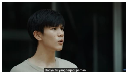
Gambar 5. Potongan Adegan Episode 1 (4/4) Menit 2:23

Pada analisis level realitas melalui kode lingkungan diketahui bahwa Jim dan Li-Ming merupakan keluarga kecil dengan perekonomian yang tidak stabil dan bukan merupakan keluarga terpandang seperti keluarga Heart. Ayah Heart merupakan seorang polisi sehingga ketika Li-Ming dituduh telah memecahkan botol minuman keras milik ayah Heart, Jim dan Li-Ming merasa terjebak dalam situasi yang sulit karena mereka tidak dapat membantah tuduhan tersebut. Meskipun mereka akhirnya mengalah, Li-Ming tetap merasa kesal atas tuduhan tersebut. Li-Ming kesal karena kebenaran yang sesungguhnya adalah Heart memecahkan botol minuman keras milik ayahnya ketika ia terkejut dengan kehadiran Li-Ming. Heart merupakan seorang tuli sehingga ia tidak mendengar ketika Li-Ming datang dan menghampirinya.