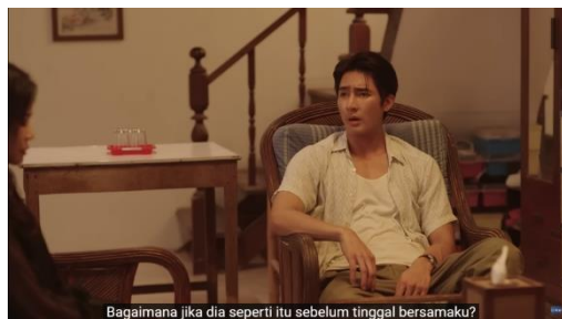
Gambar 11. Potongan Adegan Episode 7 (2/4) Menit 0:40

Pada scene ini Jam, kakak Jim yang juga merupakan Ibu dari Li-Ming merasa bahwa Li-Ming secara tiba-tiba menjadi seorang gay karena terpengaruh oleh kehidupan pamannya yang juga merupakan seorang gay. Hal tersebut digambarkan melalui dialog yang diucapkan oleh Jam pada gambar 10. Jam menyalahkan Jim karena menurutnya selama Li-Ming tinggal bersamanya, ia tidak pernah menunjukkan ketertarikannya kepada laki-laki. Sehingga Jam merasa bahwa Jim memiliki pengaruh yang besar akan perubahan yang dialami oleh Li-Ming.