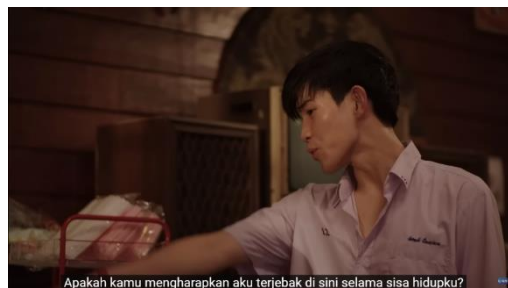
Gambar 9. Potongan Adegan Episode 3 (3/4) Menit 7:12

Hal tersebut digambarkan melalui kode dialog dalam analisis level representasi. Beberapa dialog yang diucapkan oleh Jim yaitu “Kamu? Pergi ke Amerika? Untuk apa kamu pergi kesana dengan nilai yang rendah?”, “Apakah kamu percaya kamu bisa mendaratkan kakimu di sana?”, “Apa yang bisa kamu lakukan di sana?”, “Apakah kamu bahkan punya uang untuk membawamu ke sana?”. Mendengar berbagai macam pertanyaan yang diucapkan oleh Jim, Li-Ming semakin merasa tertekan dan kesal karena ia merasa pamannya tidak percaya dengan dirinya sehingga ia mengatakan “Apakah paman mengharapkan aku untuk terjebak di sini selama sisa hidupku?”. Li-Ming merasa ia sudah dewasa dan tidak ingin terus memberikan beban kepada Jim. Ia ingin hidup mandiri di Amerika dengan mencari kerja serta pengalaman di sana.