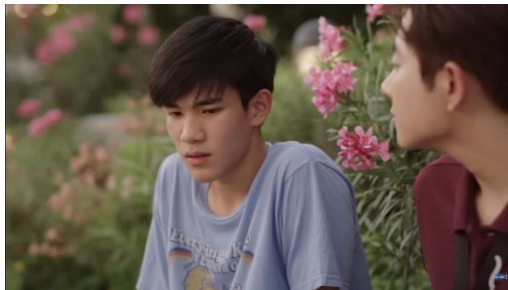
Gambar 1. Potongan Adegan Episode 3 (3/4) Menit 9:50

Fase ketika individu merasa sulit dan meragukan keputusan yang akan atau telah dibuatnya. Fase ini direpresentasikan melalui adegan 4 di mana Li-Ming merasa bimbang dalam menentukan rencana masa depannya. Pada scene tersebut, Li-Ming bercerita kepada Wen bahwa ia tidak tertarik untuk belajar. Ia hanya ingin bekerja dan menghasilkan uang. Tetapi ketika Wen bertanya mengenai apa yang ingin lakukan kedepannya, Li-Ming berkata bahwa ia belum tahu karena cita-citanya terus berubah seiring waktu. Representasi fase ini diperkuat dengan analisis menggunakan level realitas melalui kode gerakan dan kode ekspresi yang ditunjukkan oleh Li-Ming.