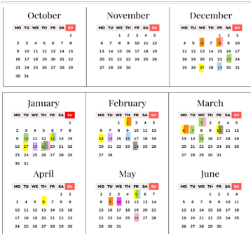
Lampiran 2. Jadwal Corrective Maintenance Mesin Ultrasonography