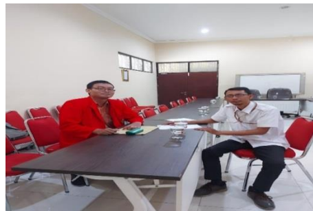
Dokumentasi peneliti dengan Staf Pemberdayaan Masyarakat Bidang Kebersihan Dinas Lingkungan Hidup Kota Surabaya