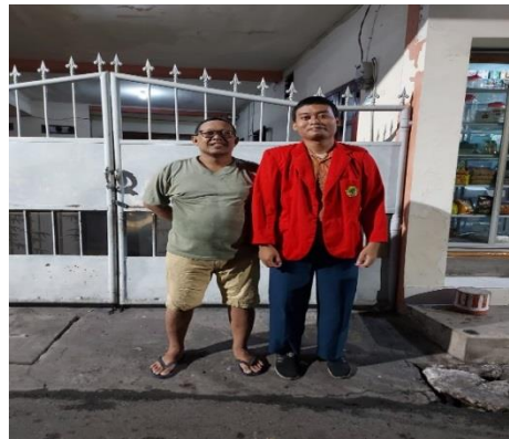
Dokumentasi peneliti dengan warga Dinoyo Tangsi ecogreen di kampung Dinoyo Tangsi Surabaya