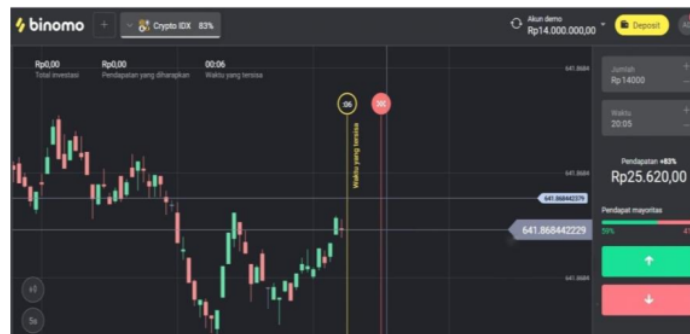
Gambar 1. Grafik Jual Beli Mata Uang Pada Salah Satu Platform Binary Option

Tidak hanya itu, pada akun demo itu jumlah para trader sanggup memahami sebagian tahap saat sebelum melaksanakan perdagangan pada aplikasi binomo. Ada pula contoh diagram jual beli mata uang dalam binomo yakni: