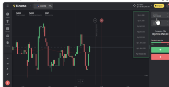
Gambar 4. Menentukan Jumlah Uang Yang Ingin Diperdagangkan

Pada gambar di atas meyakinkan bila trader mampu memilah durasi lama yang akan digunakan dalam membenarkan pergerakan kurs mata uang. Terdapat pula lama minimal yang mampu dipilih ialah 1 menit dan maksimal hingga 1 jam.