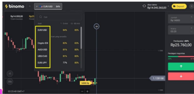
Gambar 2. Grafik Pertukaran Mata Uang Pada Salah Satu Platform Binary Option

Seorang trader sanggup trading memakai beraneka ragam pendamping mata duit, barang, indikator saham, serta kripto. Antara lain: USD atau JPY, AUD atau JPY, GBP atau USD, USD atau CHF, USD atau CAD, AUD atau CAD, EUR atau NZD, EUR atau CHF, EUR atau USD, EUR atau JPY, Perak, Brent Crude Oil, serta Kencana. Catatan aset ini lalu meningkat dari durasi ke durasi. Pada gambar di atas ditunjukkan sebenarnya trader bisa memilah pendamping mata uang yang mana mau dipikani oleh para trader. Tidak hanya itu, ditunjukkan pula jumlah profit yang dapat diperoleh oleh trader semacam pendamping duit Euro serta US Dollar sebesar 84%, Dollar Australia serta Dollar Kanada sebesar 81%, Dollar Australia serta Yen Jepang sebesar 81% serta berikutnya.