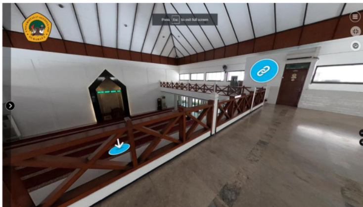
Gambar 8. Tampilan ikon pada foto Masjid Baitul Fikri

Gambar 7. terlihat ikon dengan huruf (i) memiliki fungsi apabila ditekan akan muncul informasi tertentu yang telah diberikan, serta ikon panah yang apabila ditekan akan menuju ke foto panorama selanjutnya yang telah ditentukan pada masing – masing ikon tersebut.