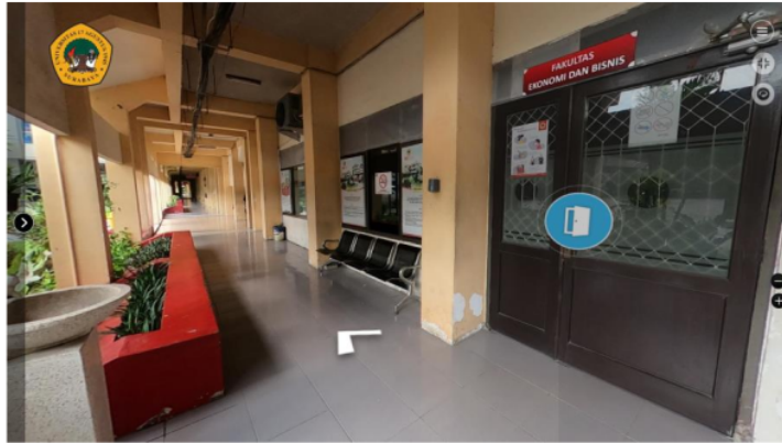
Gambar 9. Tampilan foto panorama depan ruang tata usaha (TU) Fakultas Ekonomi dan Bisnis (FEB)

Gambar 9 Terlihat tampilan ikon pintu yang memiliki fungsi masuk kedalam ruangan yang telah ditentukan. Pada gambar tersebut ruangan yang telah ditentukan ialah ruang TU FEB.