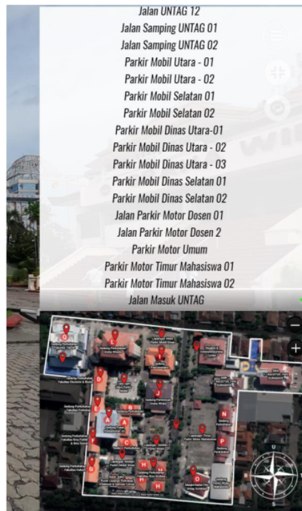
Gambar 6. Denah kecil UNTAG Surabaya yang terletak pada pojok kanan bawah

Gambar 6, merupakan tampilan dari Denah UNTAG terdapat lokasi ikon berwarna merah yang apabila ditekan akan ditunjukkan ke lokasi panorama tertentu. Pada dropdown juga terdapat panorama – panorama yang apabila ditekan akan ditunjukkan ke tempat tertentu yang dituju.