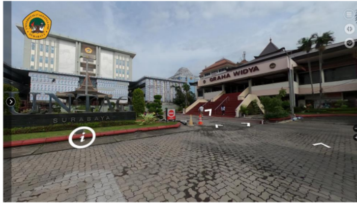
Gambar 7. Tampilan foto setelah gerbang depan UNTAG yang terdapat beberapa ikon yang memiliki fungsinya.

Gambar 7. terlihat ikon dengan huruf (i) memiliki fungsi apabila ditekan akan muncul informasi tertentu yang telah diberikan, serta ikon panah yang apabila ditekan akan menuju ke foto panorama selanjutnya yang telah ditentukan pada masing – masing ikon tersebut.