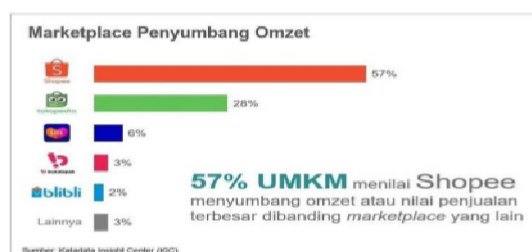
Gambar 1.1 Rating omzet marketplace di Indonesia

Pada saat ini mayoritas masyarakat telah mengenal internet dan smartpone Dengan kemajaun dan berkembangnya teknologi menjadikan internet semakin cepat. Beragam kalangan masyarakat dapat mengakses internet kapanpun dan dimanapun. Internet memiliki berbagai kemanfaatan, diantaranya ialah berbelanja. E-commerce ialah kegiatan penyebaran, jual beli, pemasaran produk lewat internet. Dengan situs online ataupun aplikasi, konsumen tidak harus mengunjungi tempat berbelanja, namun cukup mengakses situs yang menyediakan jual beli online, sehingga konsumen bisa melakukan pembelian produknya via online. Menurut peneliti diantara e-commerce yang perkembangannya tergolong cepat di Indonesia ialah Shopee.