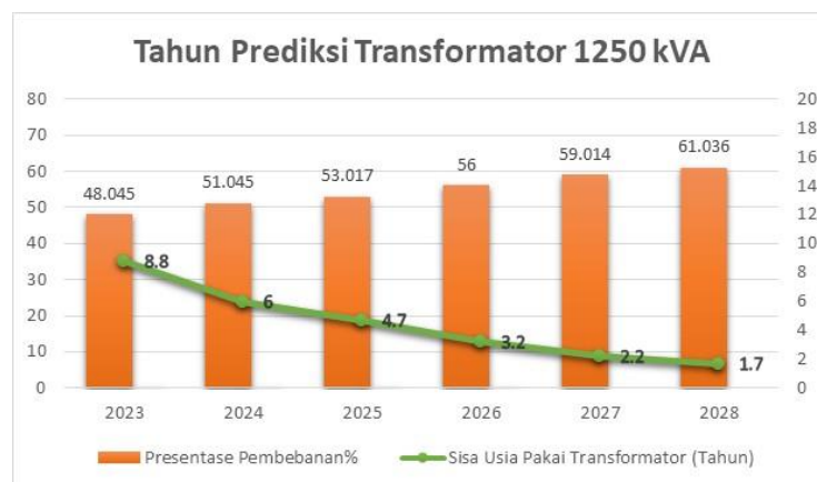
Gambar 2. Grafik Prediksi Usia Pakai Transformator 1250 KVA

Maka hasil dari perhitungan dengan metode regresi linear didapatkan hasil usia pakai transformator pada tahun 2028 yaitu sebesar 1 tahun 7 bulan dengan pembebanan 54%.