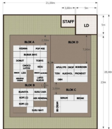
Gambar 2 Layout Usulan

Dari desain warehouse usulan, menjadi ada perubahan pada warehouse yang diusulkan, penataan barang tidak berantakan produk jadi kemasan di kelompokkan berdasarkan jenis produk lebih mudah mencari barang.